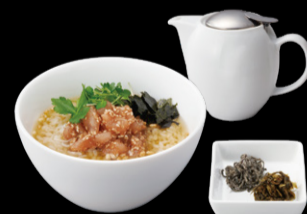
天然カジキ鮪の 胡麻和え出汁茶漬 ¥1,050