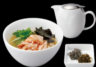
やわらか鶏明太の 出汁茶漬 ¥1,000