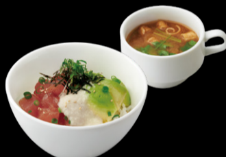
天然鮪とアボカドの とろろどんぶり ¥1,380 s ¥1,230