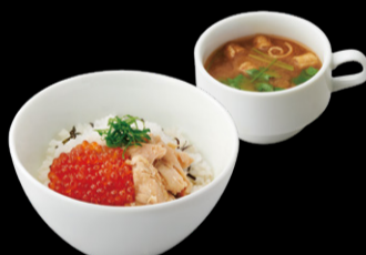
いくらと鮭の 親子どんぶり ¥1,380 s ¥1,230