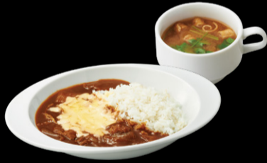
牛肉チーズ ハヤシライス ¥1,300