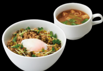
鶏そぼろどんぶり ¥1,200 s ¥1,050