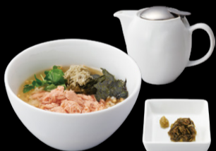
鮭ととろろ昆布の 柚子胡椒出汁茶漬 ¥1,000