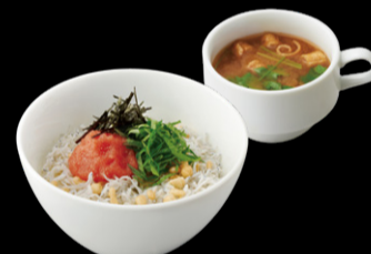
釜あげしらすと 明太子のどんぶり ¥1,200 s ¥1,050