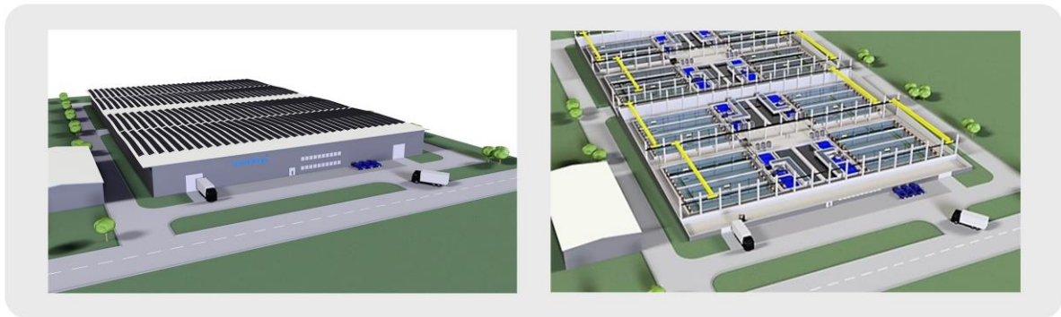
Oceanloop-Farm mit 2.000 Tonnen Zuchtvolumen pro Jahr

Die Erweiterung der Oceanloop Zuchtkapazitäten in Europa bis zum Jahr 2027 auf über 2.000 Tonnen Kapazität im Jahr erfolgt in Verbindung mit dem Bau einer eigenen Brutanstalt für die Erzeugung von Garnelenlarven. Eine Internationalisierung der Oceanloop-Farmen in andere importabhängige Märkte wie die USA, den mittleren Osten oder Japan ist ebenfalls vorgesehen.