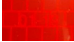
Tabla A - Retrorreflectividad

Ejemplo de mes y año de fabricación que exige la norma colombiana.