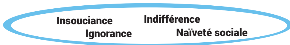
TABLEAU ÉVOLUTIF DE LA CONSTRUCTION IDENTITAIRE APPLIQUÉ À L'INTERVENTION