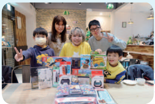
12/16 小浸想擁有遊戲機