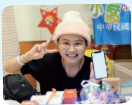
12/17 小喬想擁有智慧型手機