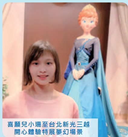
喜願兒小珊至台北新光三越 開心體驗特展夢幻場景

台灣華特迪士尼於去年年末至今年三月舉辦大人、小孩都喜愛的「冰雪奇緣夢幻特展」，特別款待重症孩子和家人共襄盛舉，並為孩子準備了豐富的禮物，在寒冷的季節帶給喜願家庭滿滿的驚喜與溫暖。