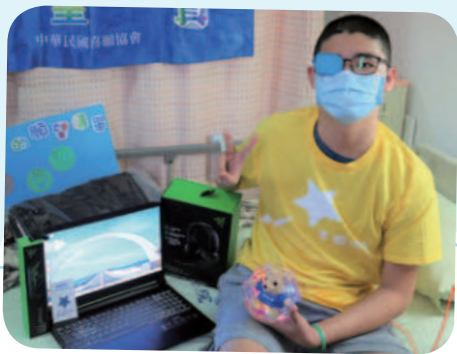
11/18 阿璋想擁有筆記型電腦