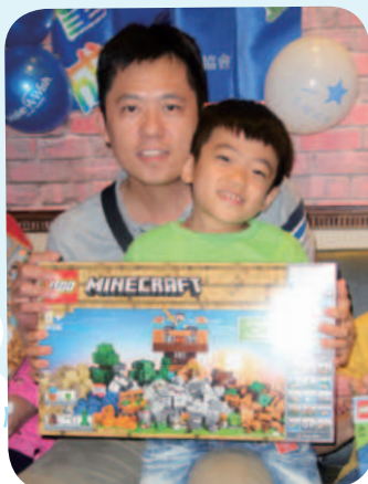
10/31 阿賢想擁有樂高玩具