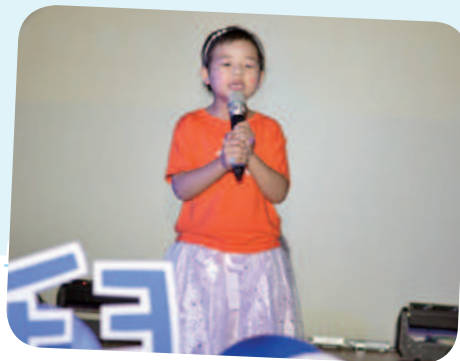
10/17 亘亘想成為歌手開演唱會