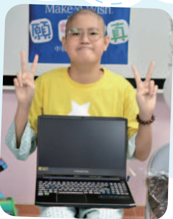
10/21 阿昕想擁有筆記型電腦