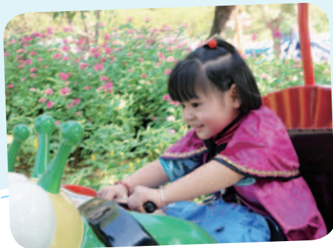
11/22 小韻想成為安娜公主