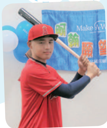
12/13 阿翰想擁有職棒球員鱒魚的 簽名禮物