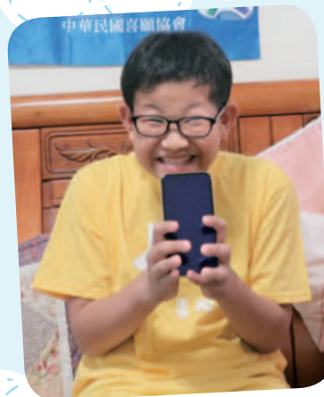
12/13 阿翔想擁有智慧型手機