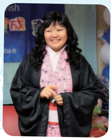
11/11 小婷想擁有生日變裝派對