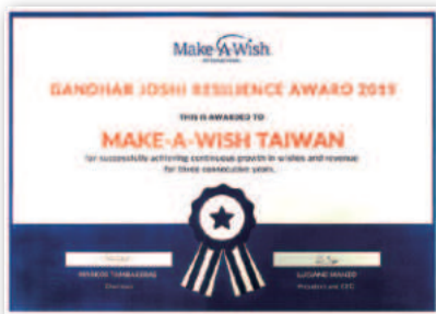
台灣分會獲頒 「2019 GANDHAR JOSHI RESILIENCE AWARD」