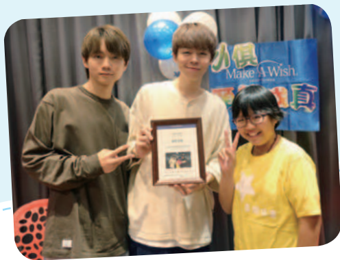
11/26 小俱想要見YouTuber—黃氏兄弟