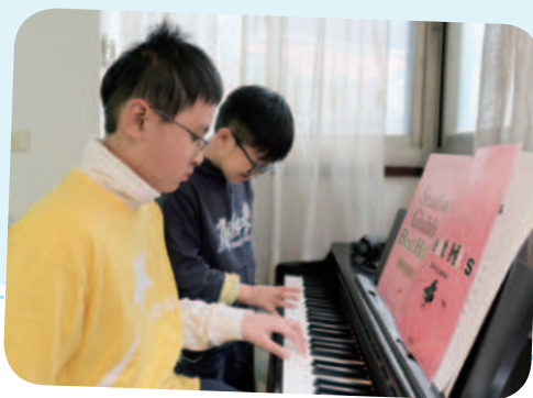
12/19 阿嘉想擁有數位鋼琴