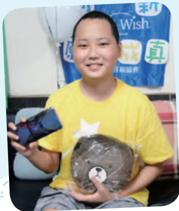
10/22 阿新想擁有智慧型手機