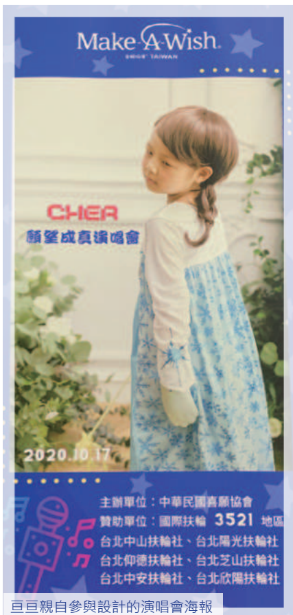
巨巨親自參與設計的演唱會海報