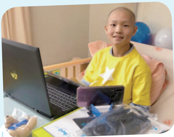
阿堯想擁有筆記型電腦