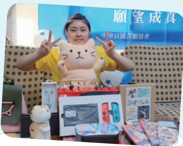
小覺想擁有遊戲機