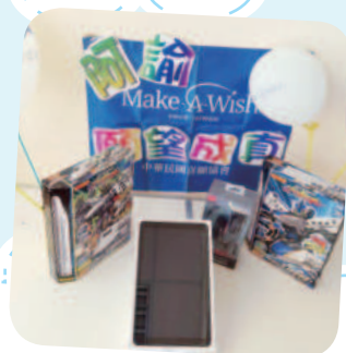
阿諭想擁有平板電腦