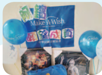
阿鑽想擁有 NBA 球星周邊禮物