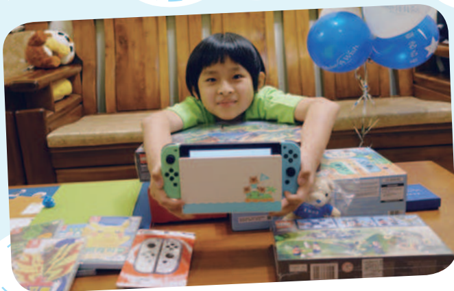
阿辰想擁有遊戲機