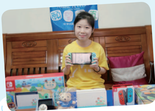
小蓉想擁有遊戲機