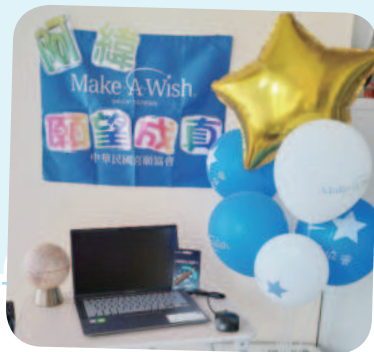
阿緯想擁有筆記型電腦