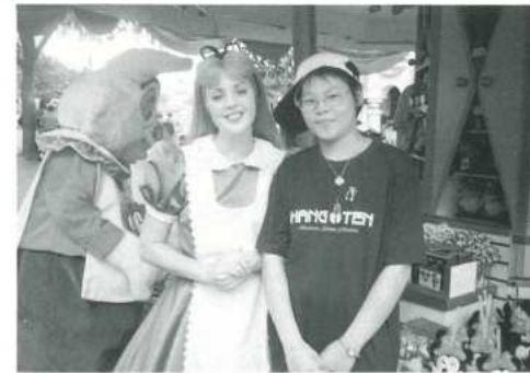
▲欣怡和愛麗絲同遊仙境