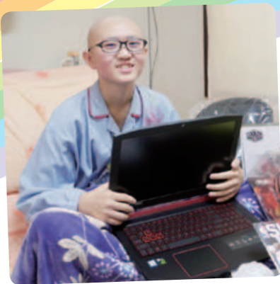
阿廷想擁有筆記型電腦