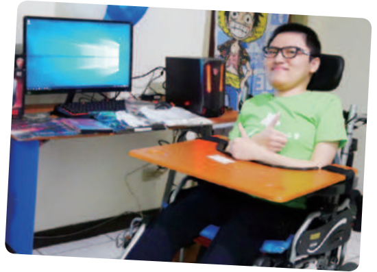
阿昇想擁有桌上型電腦