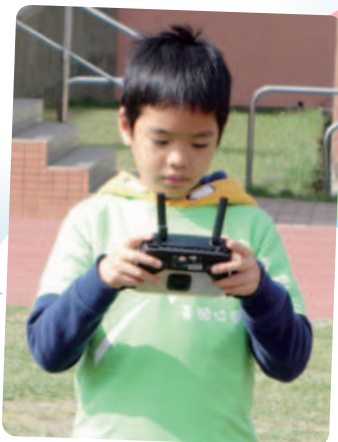
阿程想擁有空拍機