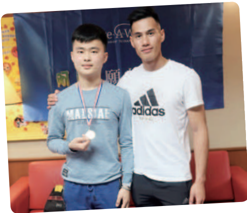
阿朋想要見短跑選手楊俊瀚先生