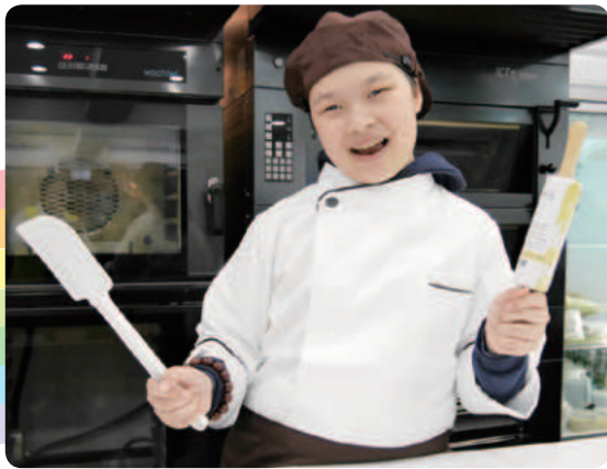
小縈想成為甜點師