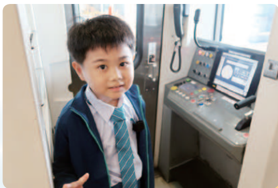
阿翰想成為高雄捷運駕駛員