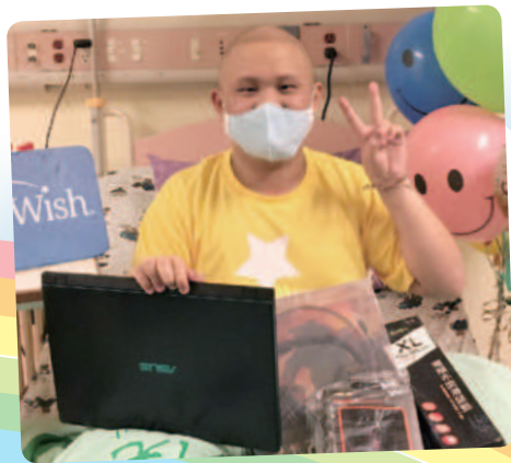
阿翔想擁有筆記型電腦