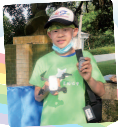
阿博想擁有空拍機