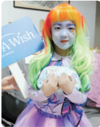
小然想擁有彩虹小馬變裝派對