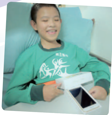
阿廷想擁有智慧型手機