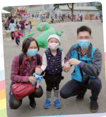
阿照想和家人一起出遊