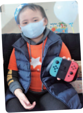
小晴想擁有遊戲機