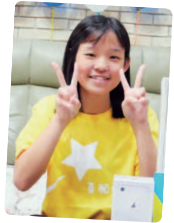
小琦想擁有智慧型手機