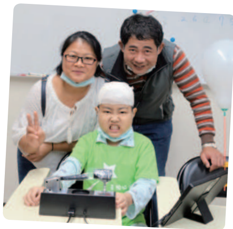
阿岑想擁有火車駕駛遊戲機