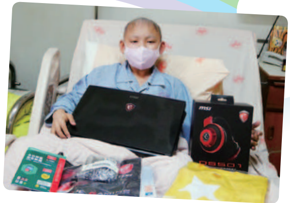
阿璋想擁有筆記型電腦