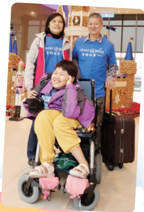
小欣想要去五月天演唱會