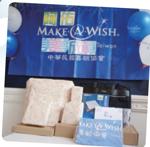
阿佑想擁有筆記型電腦