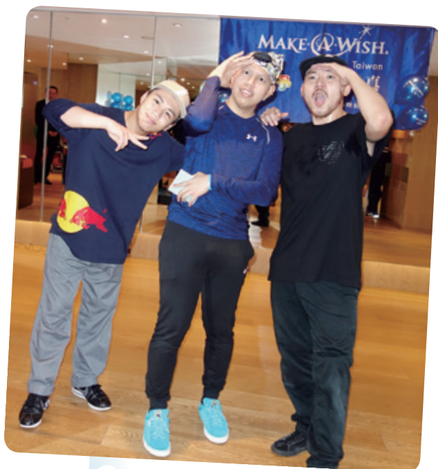
阿予想要見 B-boy 明星 Issei