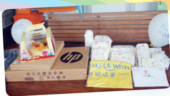
小玲想擁有筆記型電腦