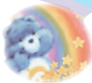
小帆想擁有歡樂派對