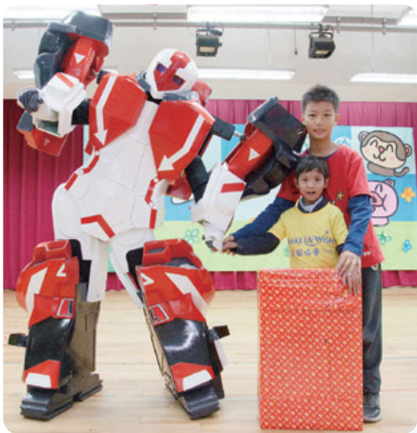
阿熹想要見機器戰士