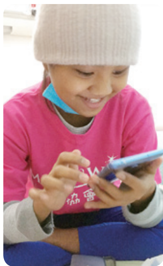
小怡想擁有智慧型手機