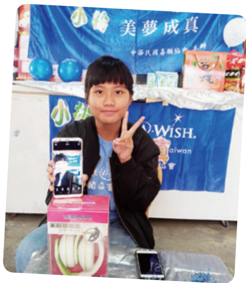
小枋想擁有智慧型手機