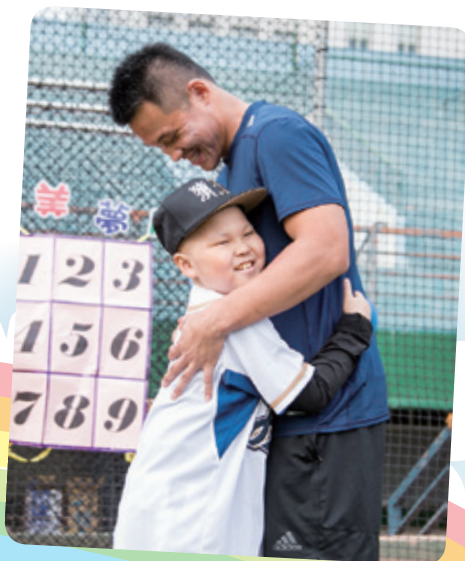
阿祐想要見 Lamigo 球員王柏融先生