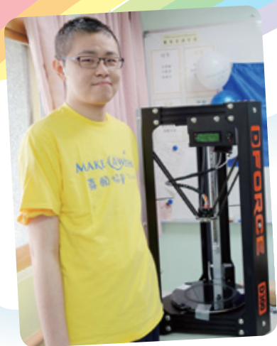
阿濬想擁有 3D 列印機