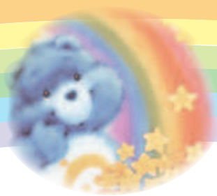
小君想擁有筆記型電腦