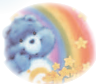
小辰想要見喜歡的玩偶