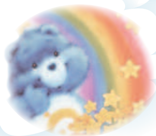
小喬想成為 Elsa 公主