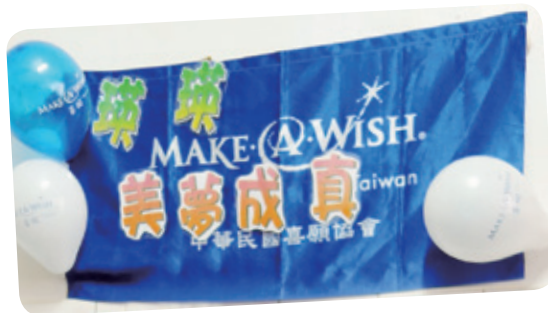
小瑛想擁有筆記型電腦