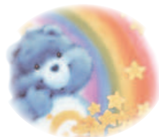
小婷想和家人一起出遊