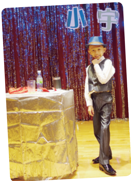
小宇想成為魔術師