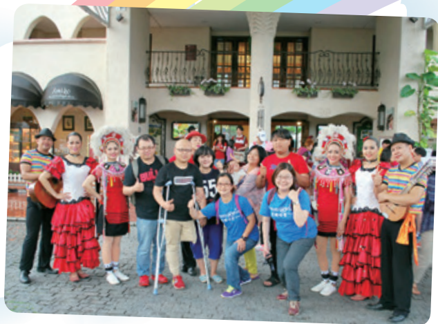
阿騰想去花蓮理想大地