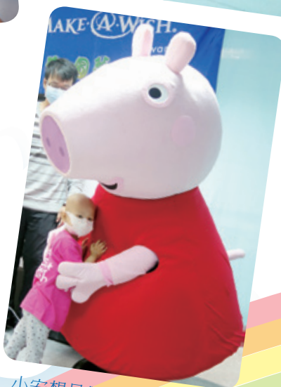
小安想見佩佩豬小妹