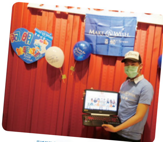
阿明想擁有筆記型電腦