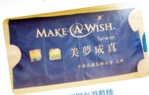
阿綸想擁有遊戲機