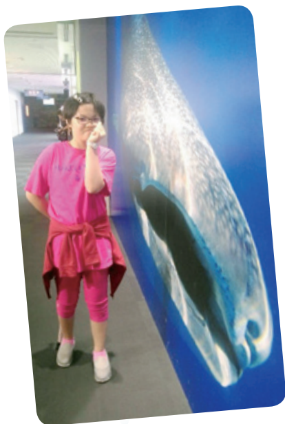
小育想去日本大阪海遊館