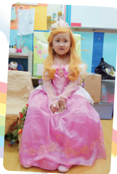
品貝想成為睡美人公主