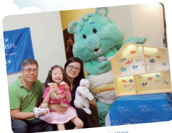
小欣想擁有仿真貓咪