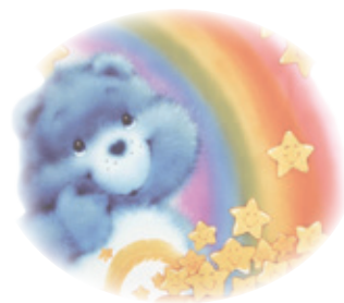
阿恭想擁有筆記型電腦