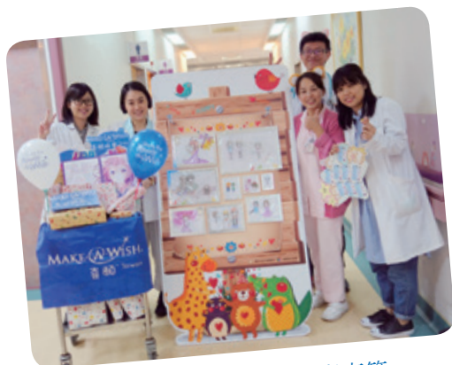
小嫻想擁有畫圖專用麥克筆