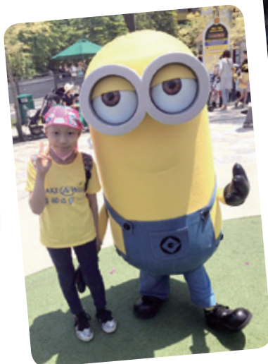
小妤想去大阪環球影城