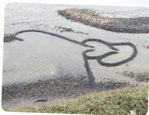
小絹想去澎湖旅遊