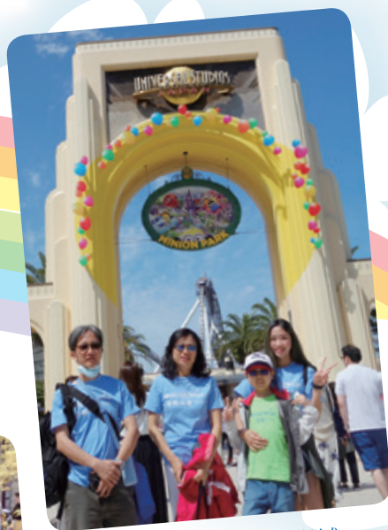
阿祐想去大阪環球影城