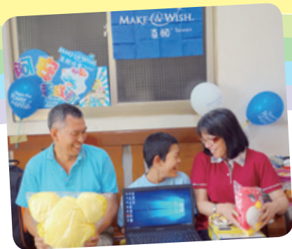
阿安想擁有筆記型電腦