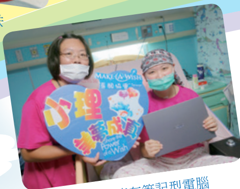
小理想擁有筆記型電腦