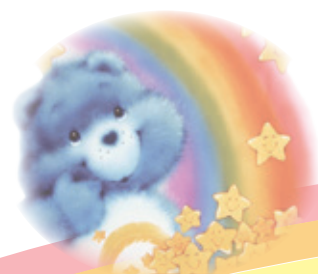
阿煒想去日本環球影城