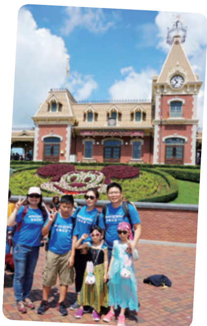
小喬想去香港迪士尼樂園