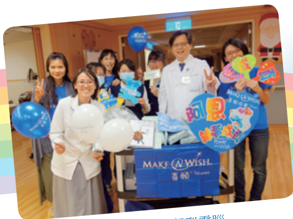
阿恩想擁有筆記型電腦