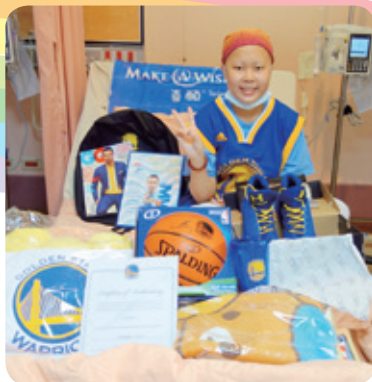
小妤想擁有 Curry 簽名禮物