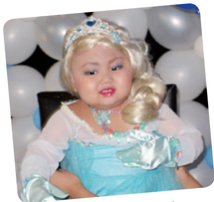
小璇想成為 Elsa 公主