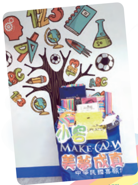
小容想擁有筆記型電腦