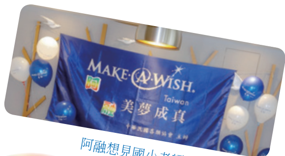
阿融想見國小老師