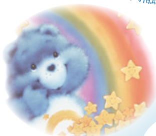
小萍想去日本環球影城