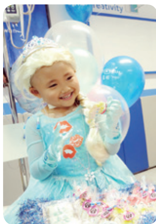
小婕想成為 Elsa 公主