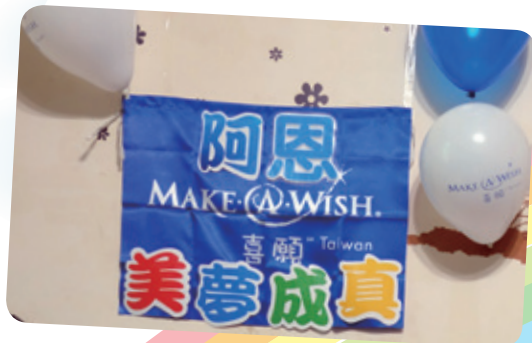
阿恩想擁有筆記型電腦