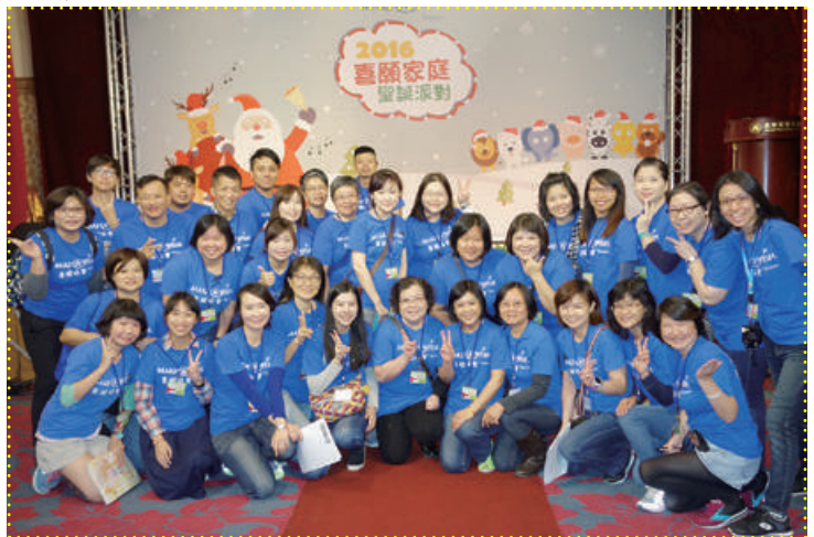
聖誕餐會幕後推手 -- 喜願志工

聖誕餐會將各地的喜願家庭、醫護人員、病友團體凝聚在一起，我們用愛牽起彼此的手，傳遞溫暖的祝福，分享希望和力量。