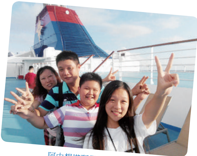
阿中想搭麗星郵輪去沖繩