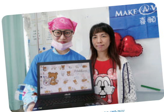
小真想擁有筆記型電腦