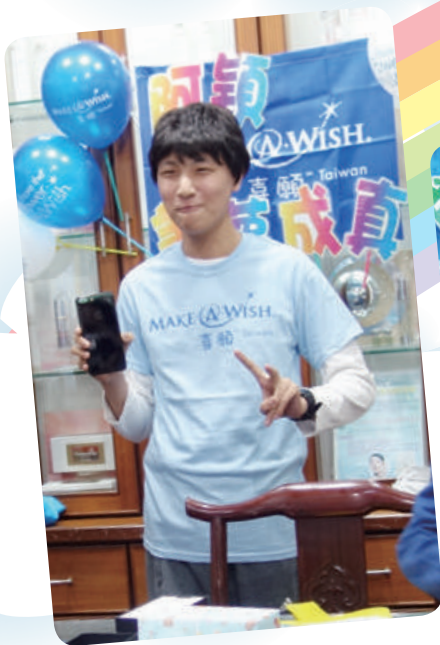
阿穎想擁有 iPhone 7 Plus