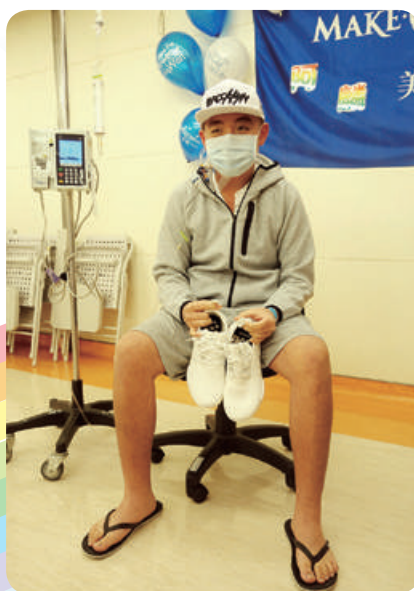
阿麟想擁有限量球鞋