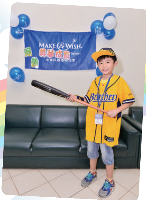
阿翰想見林智勝先生