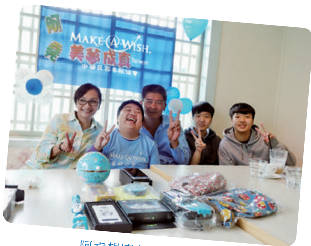
阿堯想擁有智慧型手機