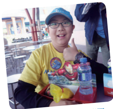
阿祐想去香港迪士尼樂園