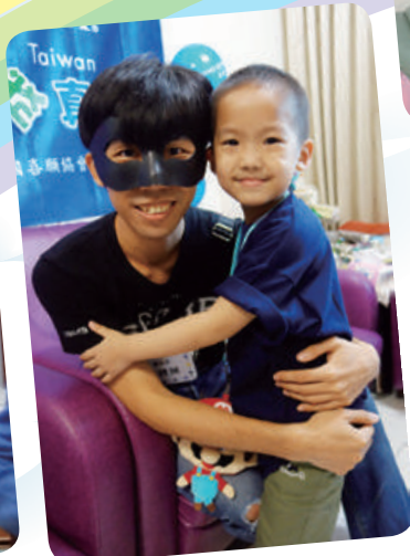
阿瑄想見實況主舞秋風