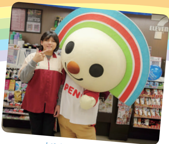
小昀想成為一日店長