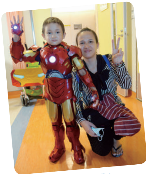
阿文想成為鋼鐵人