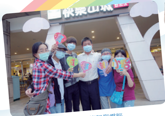
小怡想擁有筆記型電腦