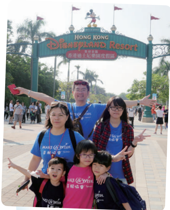
小樺想去香港迪士尼樂園