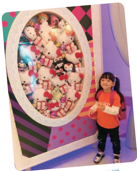
小縈想去日本 Kitty 樂園