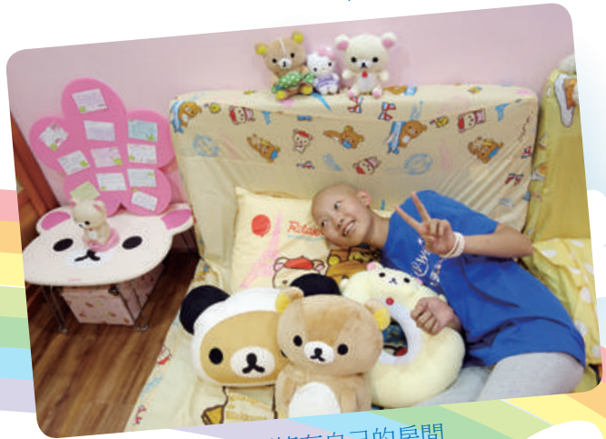
小茹想擁有自己的房間