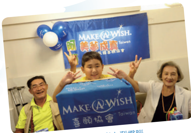
阿顯想擁有桌上型電腦