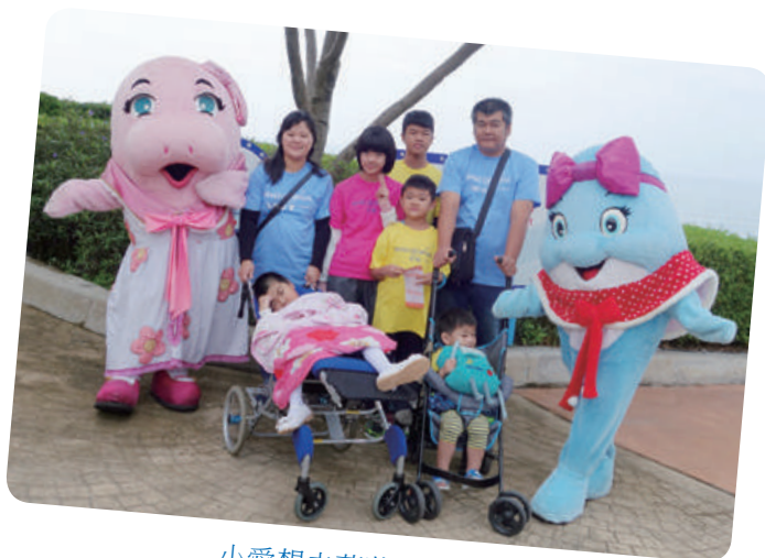
小愛想去花蓮海洋公園