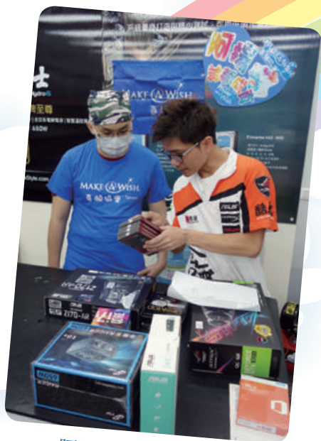
阿揚想學習組裝電腦