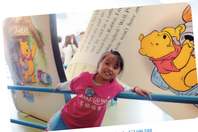
小螢想去香港迪士尼樂園