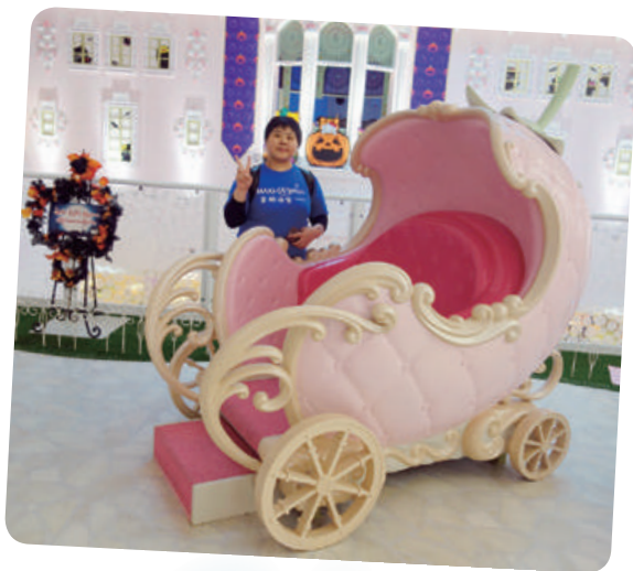
小君想去日本 Kitty 樂園