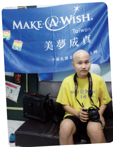
阿義想擁有單眼相機