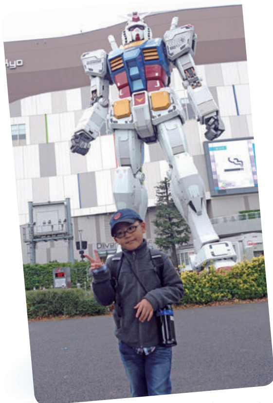
阿摩想去日本秋葉原