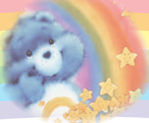
小慧想去日本宮崎駿博物館