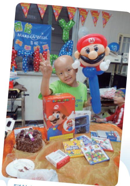
阿銘想擁有 3DSLL 遊戲機