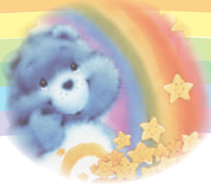
小薰想見韓國藝人