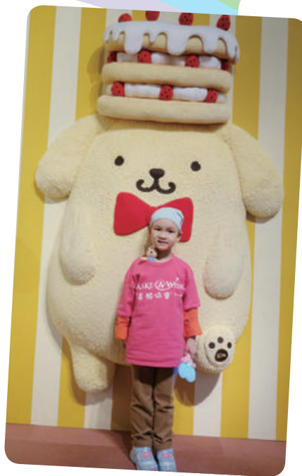
小函想去日本 Kitty 樂園