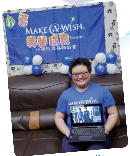
小蓉想擁有筆記型電腦