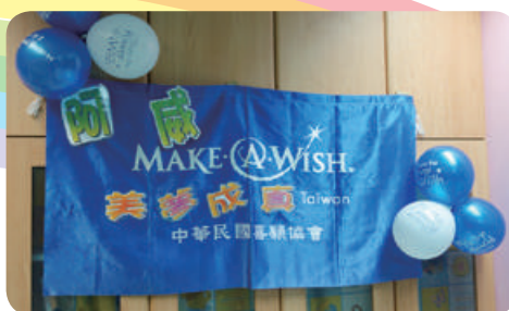
阿威想擁有智慧型手機 iPhone 6S