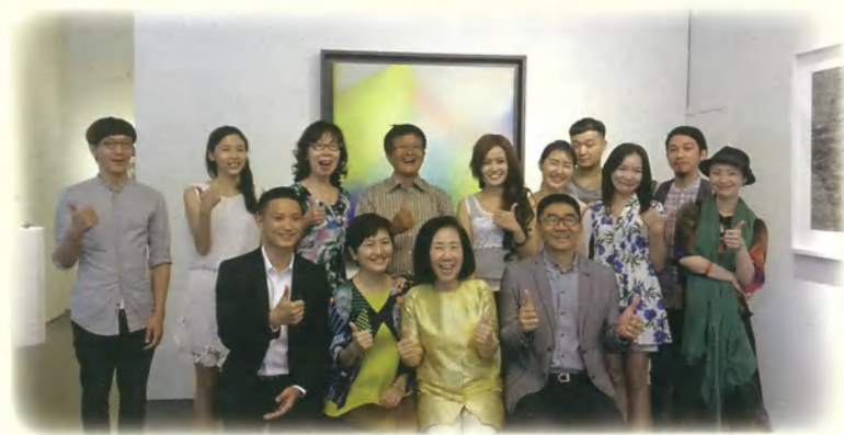
9月12日《喜願圓夢·藝愛無限》藝術慈善預展記者會