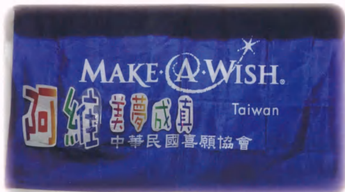
★ 我想擁有智慧型手機！ 阿維，18歲，髓母細胞瘤，8月9日圓夢