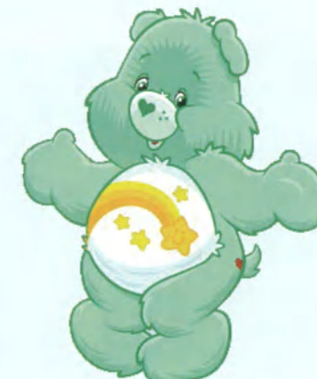
★ 我想見中信象球員彭政閔！ 阿宇，10歲，腦幹腫瘤