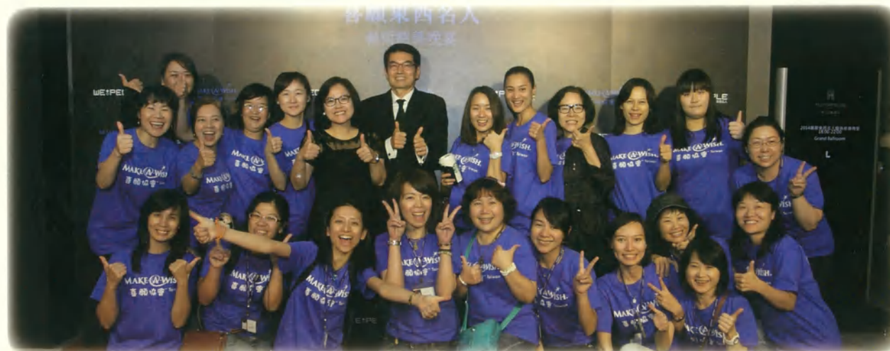
當晚幫助活動順利的幕後小尖兵~喜願志工