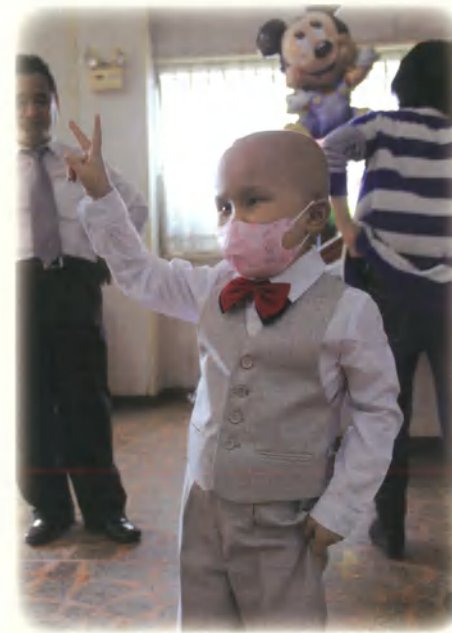
喜願兒桓桓-夢想唱歌給大家聽

最令我覺得有挑戰性是小之及小敏個案，社工跟志工鏗而不捨，一次又一次不願放棄的跟父母及孩子溝通，終於確認孩子真正的心願，也讓父母願意接受，全力配合我們的安排，雖然過程沒有那樣順利，但是圓夢時孩子的笑容就是給我們最好的回饋，事後家長更是給我們肯定及鼓勵，在在證明我們的堅持是對的!