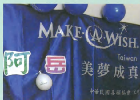
阿岳，17歲，惡性骨肉瘤，9月4日圓夢，想要筆記型電腦

謝謝喜願協會的招待，讓我到台北去圓夢，我玩得好開心喔！同時也祝大家快樂。感恩喜願協會！