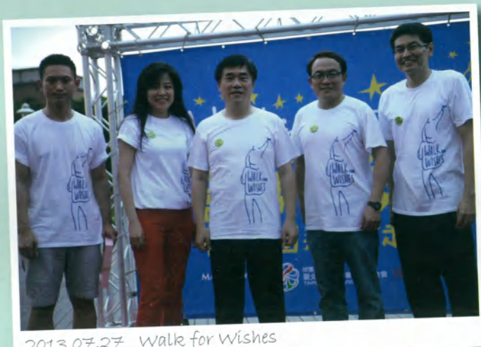
2013.07.27 Walk for Wishes