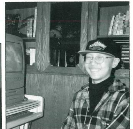
阿濬終於得到他渴望已久的『渴望』電腦！