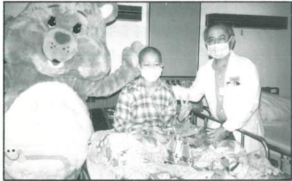
喜願熊到高雄醫學院附設醫院病房探望病童。