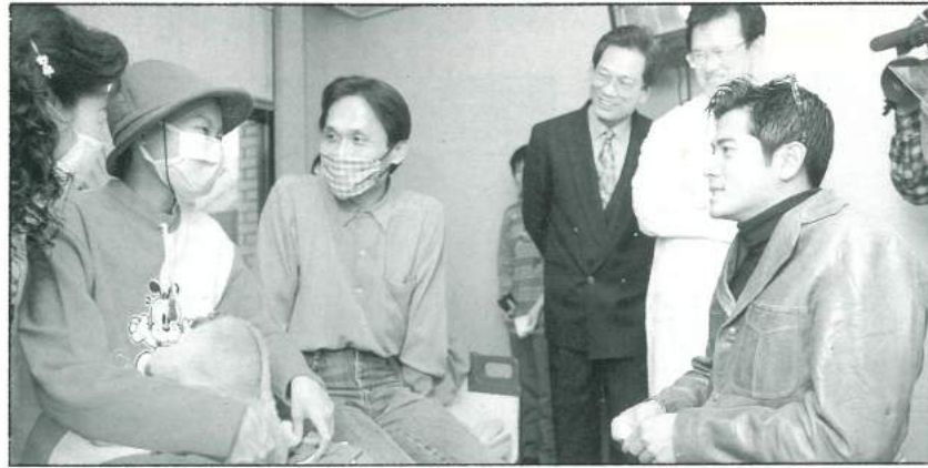
天王偶像郭富城專程到台南成大醫院探望喜願兒—琪琪