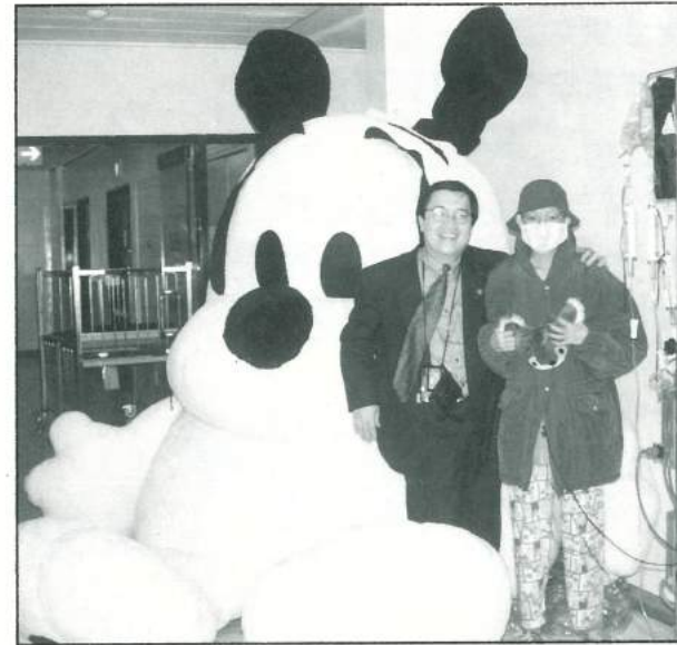
琪琪說她好想看看頭頂到天花板的巴布狗長什麼模樣，沒想到真的實現了！ (特別感謝長春藤股份有限公司熱情贊助)