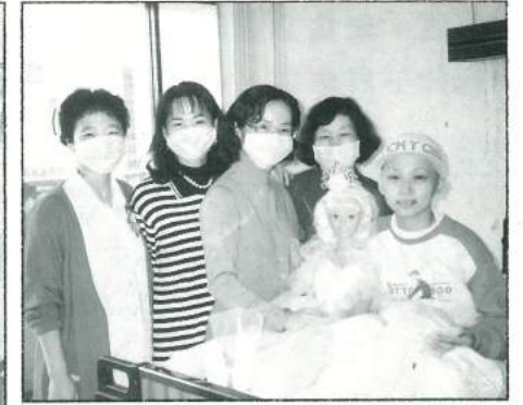
小芬希望有一個可以編辮子的芭比娃娃，協會特別由美國空運了一個身長 120 公分的芭比，教柔柔看了愛不釋手！