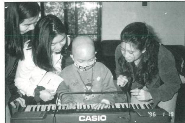
小傑希望有一架電子琴