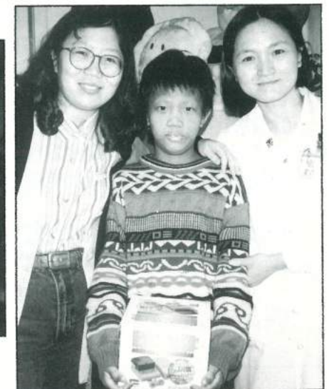
小凱與超級任天堂