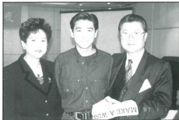
85.03.09 偶像 林志穎在感恩之夜接受表揚。