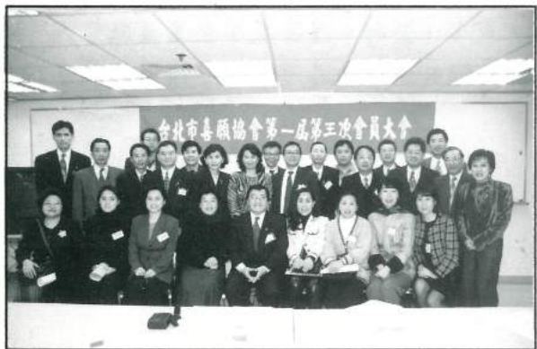
85.03.09 台北市喜願協會第一屆第三次會員大會。