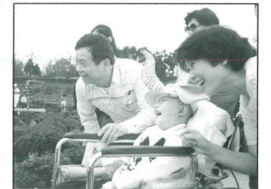
勳勳來到小人國，雖然必須乘坐輪椅，但見到這多彩多姿樂園，也不禁綻放出笑容