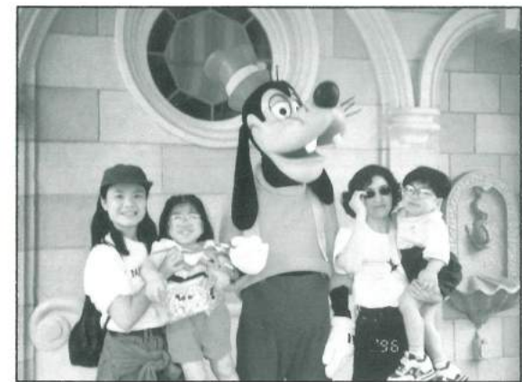
安安與璇璇與媽媽、義工開心地跟高飛狗合照