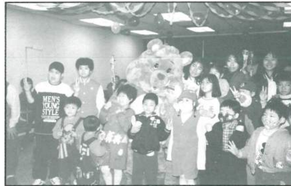
喜願熊參加馬偕醫院兒童節晚會，小朋友開心的手舞足蹈。