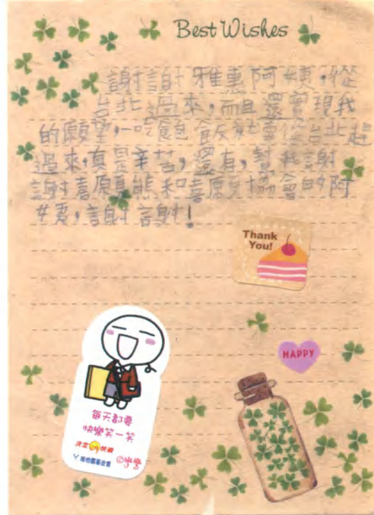
喜願兒小庭的感謝小語。