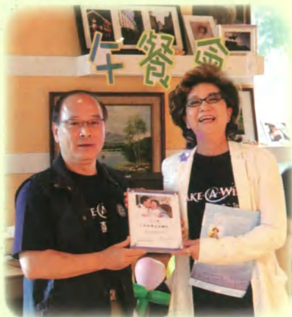
感謝台北南天扶輪社贊助活動經費。