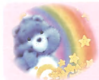
小庭・10歲・ 腦痛・ 7月21日圓夢・ 我想要筆記型電腦