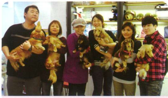
小茹·13歲·惡性骨肉瘤·12月30日圓夢·我想帶狗狗一起參加狗聚會