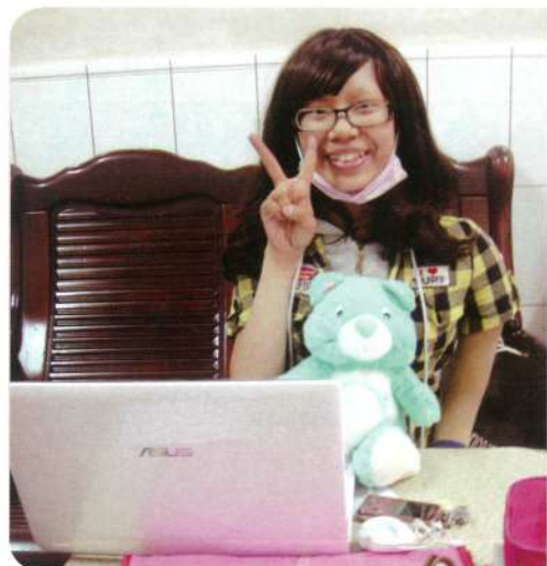
小蕙·15歲· 惡性骨肉瘤· 10月15日圓夢· 我想要一台白色 筆記型電腦