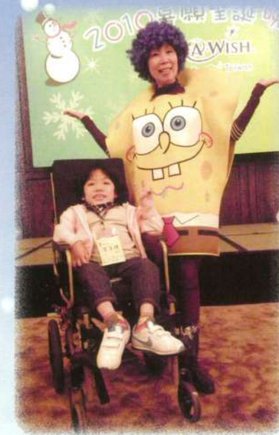
主持人是誰？海綿寶寶！