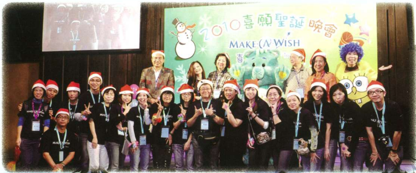
晚會志工及工作人員合影