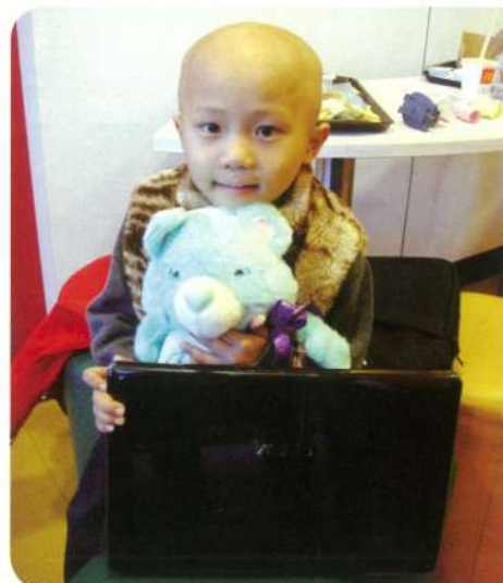
阿宇·6歲· 橫紋肌肉瘤· 12月8日圓夢· 我想要一台 筆記型電腦