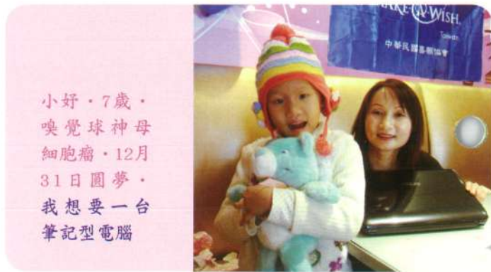
小好·7歲·嗅覺球神母細胞瘤·12月31日圓夢·我想要一台筆記型電腦