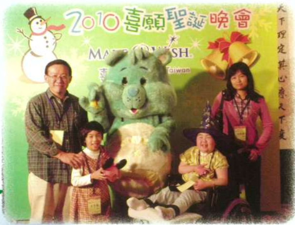
小懿和家人與喜願熊合影