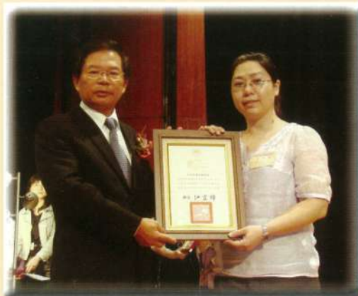
本會獲內政部98年度 全國性社會團體評鑑之甲等團體