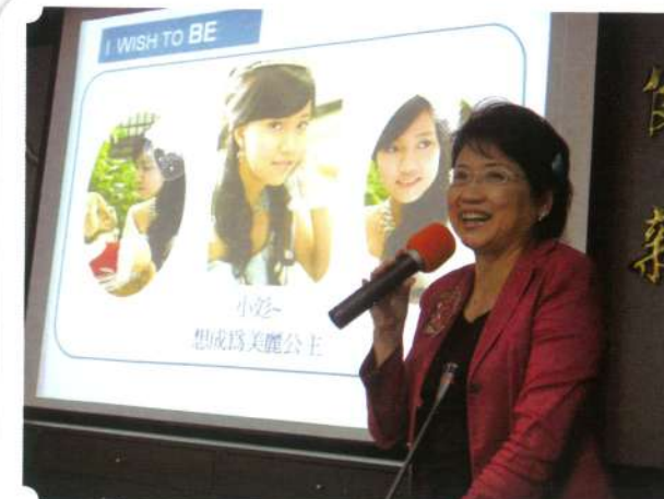
10/14 義學國小教師宣導

重症病童為生命和夢想努力的故事不僅感動他身邊的人，往往也具有啟發及鼓勵健康的孩子珍惜生命的意義，喜願協會自2009下半年展開學校生命教育理念宣導，想帶給年輕學子們珍愛自己、關懷他人、追求夢想的理念。