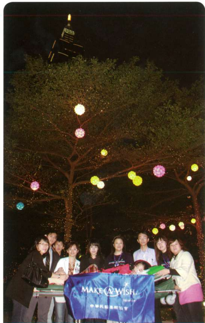
阿孟·17歲·粒腺體缺陷·12月29日圓夢·我想去信義區看大型聖誕燈飾