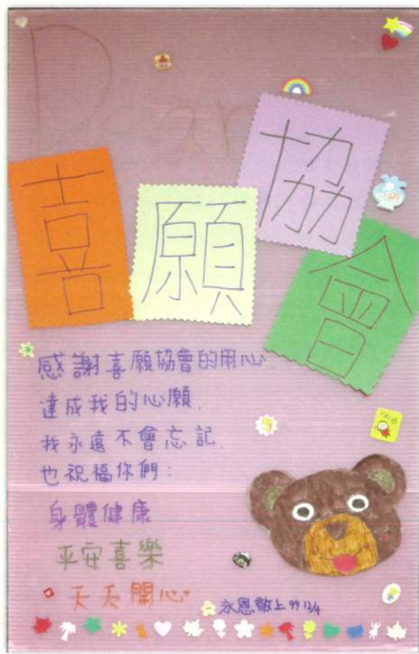
喜願兒永恩製作的卡片