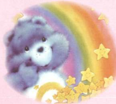
小鈞·6歲· 惡性淋巴瘤· 10月1日圓夢· 我想要一台 筆記型電腦