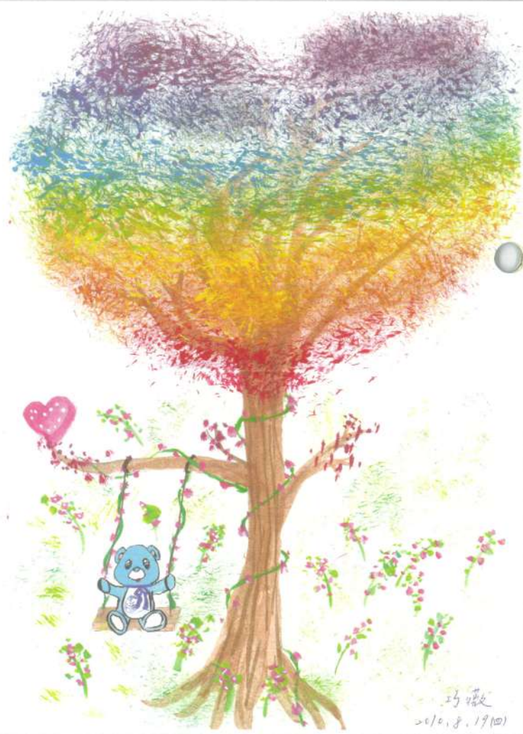
庭鈺姊姊的手繪卡片