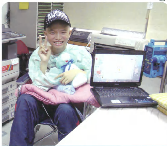
阿全·15歲·惡性橫紋肌肉瘤·3月30日圓夢· 我想要一台筆記型電腦