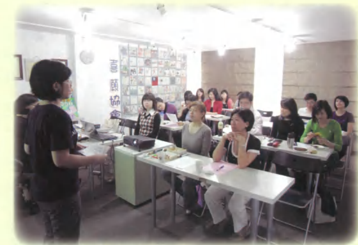
醫院訪視志工訓練：志工專心聆聽拜訪技巧

為了認識更多病童並推廣喜願圓夢的理念，本會計畫加強定期到醫院訪視，以便為需要協助的病童及家庭提供更及時的服務。為此，我們在3月3日舉辦醫院訪視志工訓練課程，向志工伙伴說明拜訪病童注意事項並分享互動技巧。未來也歡迎更多願意投入此一工作的志工朋友加入。