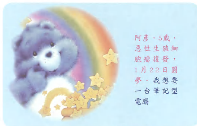
阿彥·5歲· 惡性生殖細胞瘤復發· 1月22日圓夢· 我想要 一台筆記型 電腦