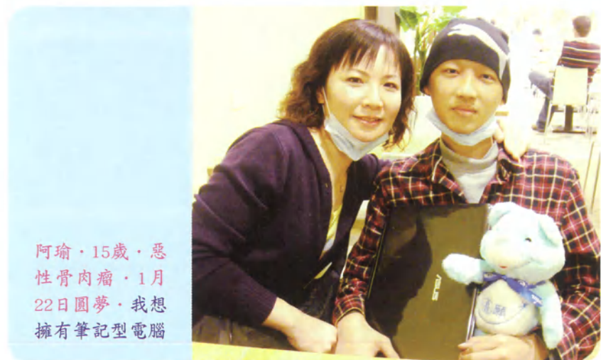
阿瑜·15歲·惡性骨肉瘤·1月22日圓夢·我想擁有筆記型電腦