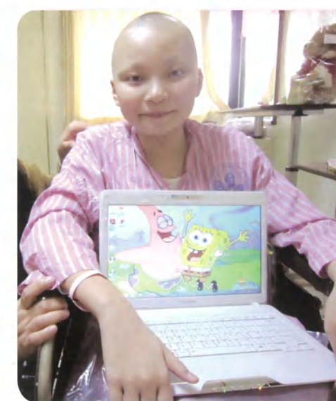
小儀·12歲·骨肉瘤·1月28日圓夢·我想要一台筆記型電腦