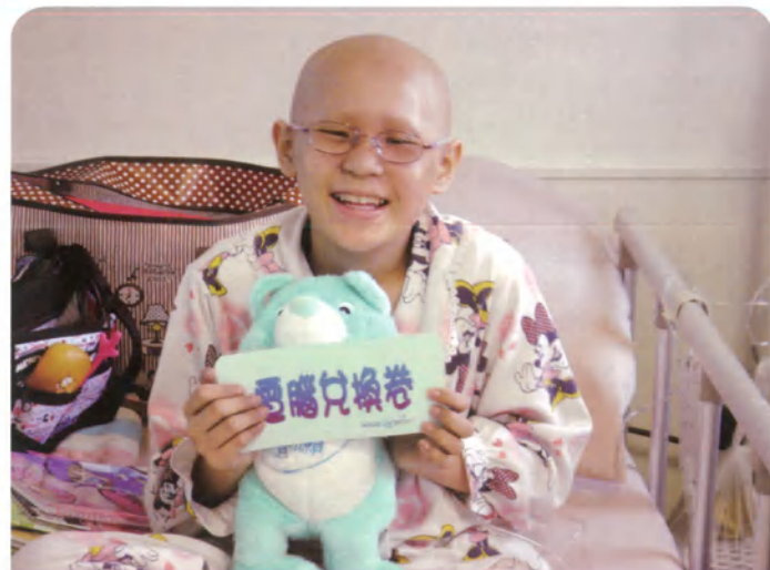
小榕·11歲·鼻腔惡性腫瘤·1月25日圓夢· 我想要一台筆記型電腦