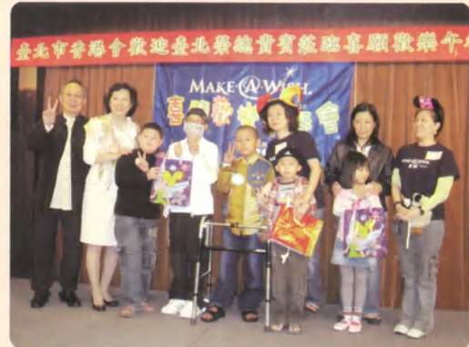
喜願理事長及香港會會長頒獎給玩遊戲第一名的小隊