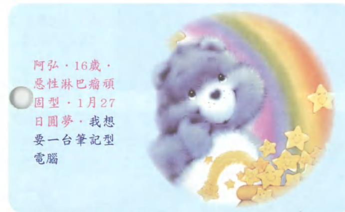
阿弘·16歲·惡性淋巴瘤頑固型·1月27日圓夢·我想要一台筆記型電腦