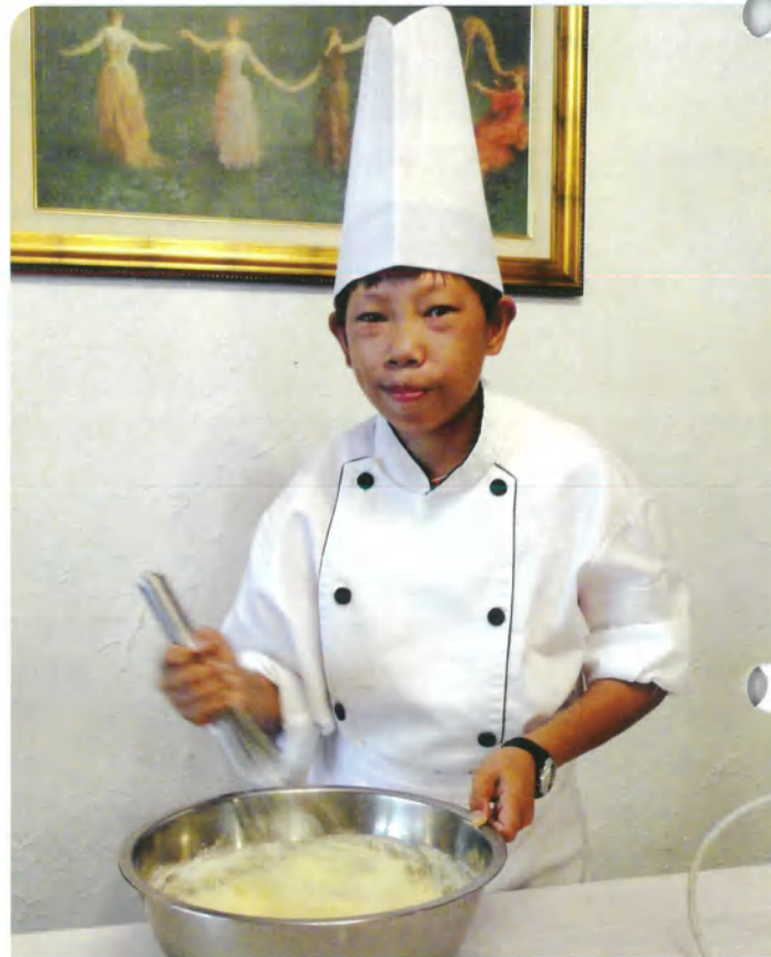
阿佑·17歲·重度海洋性貧血·12月9-10日圓夢· 我想要做天使蛋糕給媽媽吃