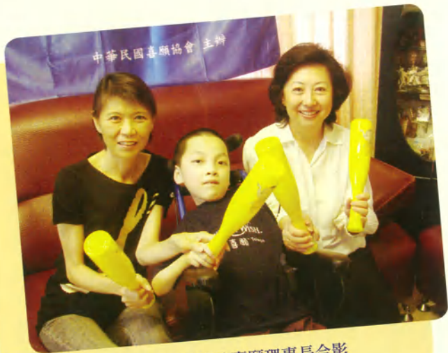
阿榮與周阿姨及喜願理事長合影

阿榮媽媽感恩地說，他們一直把阿榮當作老天爺託付的小天使在照顧，盡力讓他開心過日子，而這一天，他才知道總統夫人周美青和喜願協會是阿榮的大天使，為阿榮和他們一家人創造永遠難忘的回憶，也給阿榮無比的驚喜和快樂。