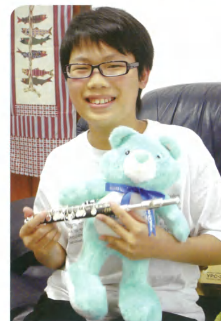
阿源·17歲·重度海洋性貧血·10月8日圓夢· 我想要一支短笛