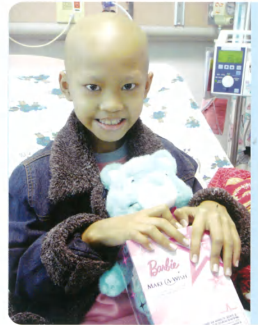
小綺·8歲·橫紋肌肉瘤·12月23日圓夢·我想要一台筆記型電腦