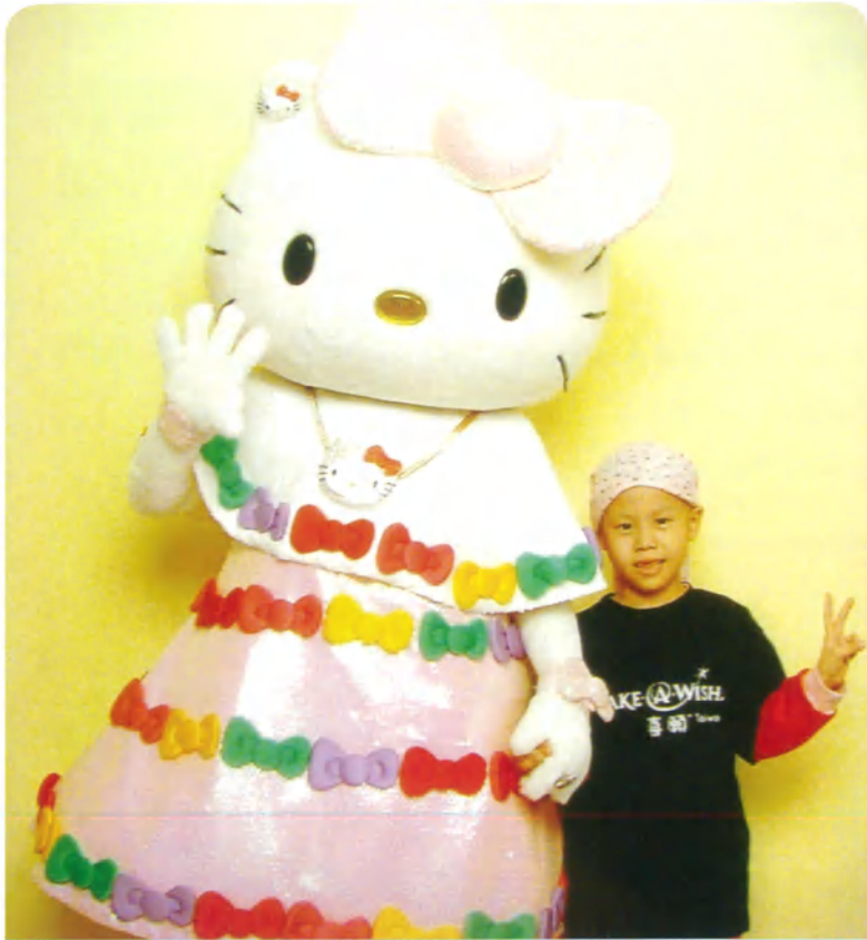
小安·6歲·腦瘤·12月9-12日圓夢·我想去日本Hello Kitty樂園