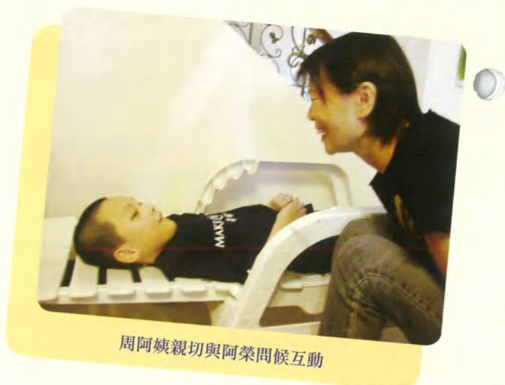
周阿姨親切與阿榮問候互動

透過喜願協會聯繫安排，在10月18日傍晚，總統夫人周美青女士在喜願協會理事長梁吳蓓琳女士陪同下親自至南投探望阿榮，陪他看職棒總冠軍第二戰比賽實況轉播，讓阿榮歡喜圓夢！