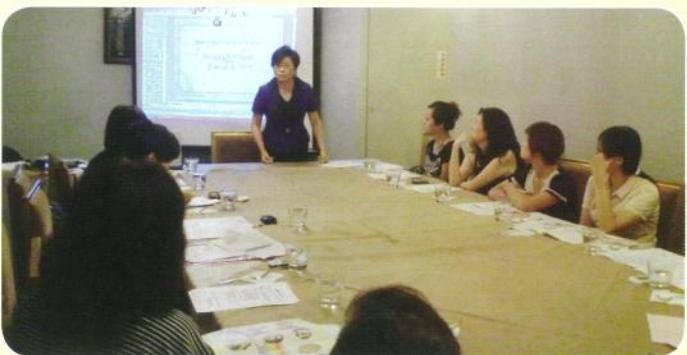
華朋扶輪社寶眷聯誼會宣導