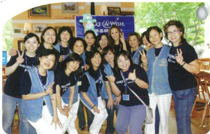
感謝南海扶輪社寶眷聯誼會贊助午餐會

在台大醫院兒癌病房護理長的考量與建議下，喜願首次在醫院病房護理站舉辦午餐會，由大飯店外匯送進病房讓病童及醫護人員一同享用，病房瀰漫著食物的香氣，一位病童母親說：「因為化療孩子已經兩三天吃不下東西了，可是看到這些餐點食慾大增.....」，病童們掛著化療點滴、坐著輪椅，但仍不減在護理站前排隊用餐的興奮情緒，興高采烈聽著社工姊姊說著喜願熊和壞巫婆的故事。在神秘嘉賓藝人范逸臣出現時達到最高潮，他為病童們演唱最受歡迎的「國境之南」、「無樂不做」，現場病童還點唱「野玫瑰」，大合唱完後，范逸臣先生也和小朋友分享自己從小到大的夢想，原來他小時候還想當超人喔！最後在大家合影簽名中活動落幕，把歡樂帶進兒癌病房就是喜願協會所期待與努力的！