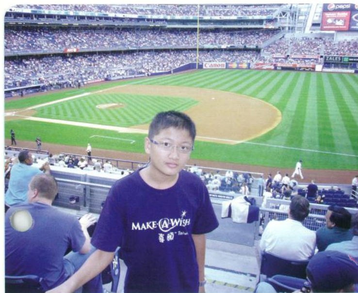
阿瑜・13歲・腦瘤・8月11-16日圓夢・我想要去紐約看 洋基隊比賽