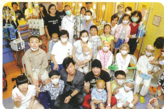
感謝北投扶輪社贊助台大午餐會