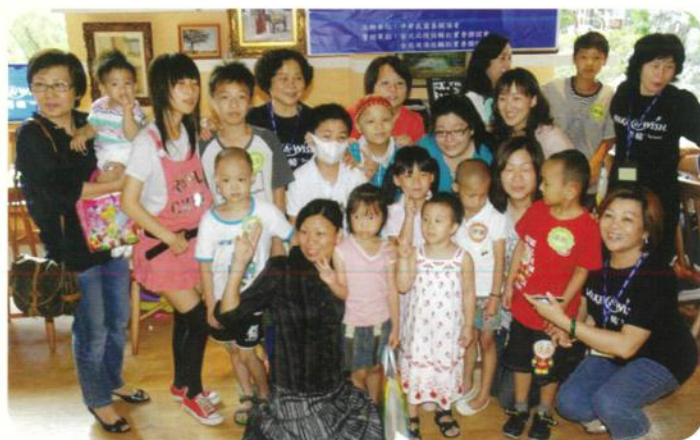
林口長庚重症病童大合照