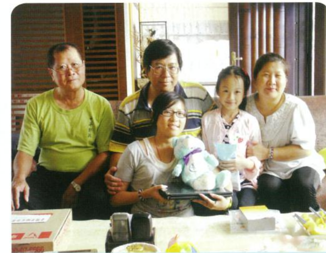
小庭・16歲・重型海洋性貧血・8月22日圓夢・ 我想要一台筆記型電腦