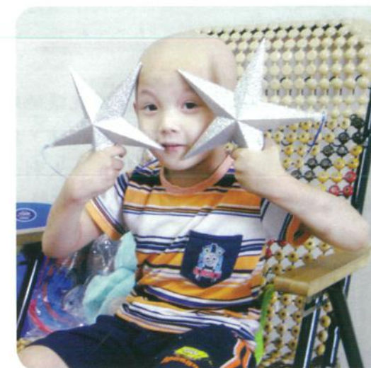
阿祐·5歲·神經母細胞瘤復發·9月21日圓夢·我想要一台DVD播放機