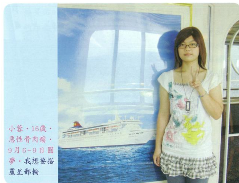
小蓉·16歲·惡性骨肉瘤·9月6-9日圓夢·我想要搭麗星郵輪