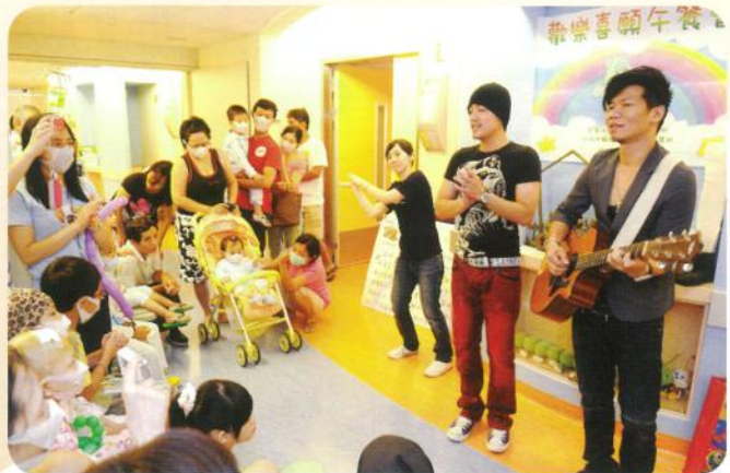
藝人范逸臣為病童們演唱國境之南

在台大醫院兒癌病房護理長的考量與建議下，喜願首次在醫院病房護理站舉辦午餐會，由大飯店外匯送進病房讓病童及醫護人員一同享用，病房瀰漫著食物的香氣，一位病童母親說：「因為化療孩子已經兩三天吃不下東西了，可是看到這些餐點食慾大增.....」，病童們掛著化療點滴、坐著輪椅，但仍不減在護理站前排隊用餐的興奮情緒，興高采烈聽著社工姊姊說著喜願熊和壞巫婆的故事。在神秘嘉賓藝人范逸臣出現時達到最高潮，他為病童們演唱最受歡迎的「國境之南」、「無樂不做」，現場病童還點唱「野玫瑰」，大合唱完後，范逸臣先生也和小朋友分享自己從小到大的夢想，原來他小時候還想當超人喔！最後在大家合影簽名中活動落幕，把歡樂帶進兒癌病房就是喜願協會所期待與努力的！