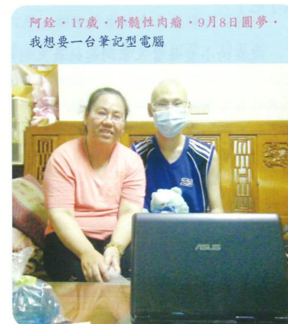
阿銓·17歲·骨髓性肉瘤·9月8日圓夢·我想要一台筆記型電腦