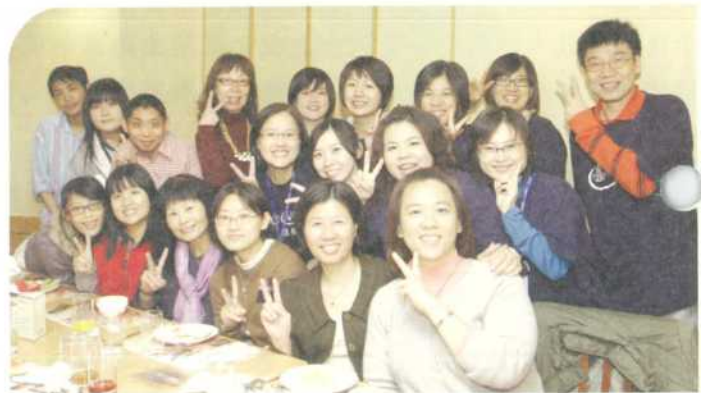
▲北部志工熱烈支持