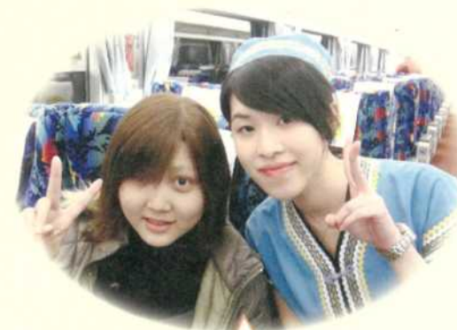
小慧·16歲·橫紋肌肉瘤·3月7-9日圓夢·我想搭觀光火車到花蓮