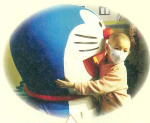
阿俊·5歲·神經母細胞瘤·1月22日圓夢·我想見多啦A夢