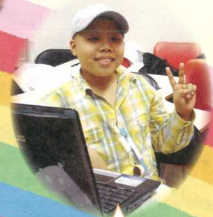
阿維·12歲·腦部生殖細胞瘤·3月26日圓夢·我想擁有筆記型電腦