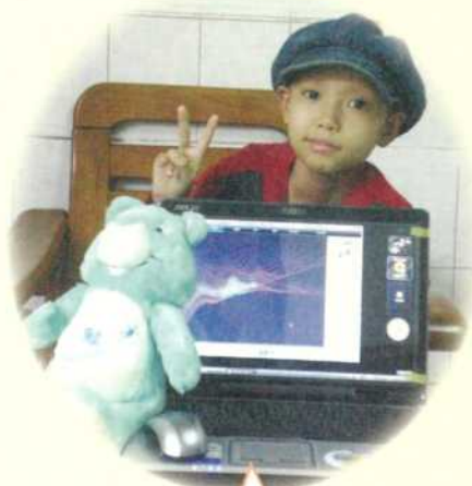
小庭·9歲·惡性腦瘤·1月6日圓夢·我想擁有一台筆記型電腦