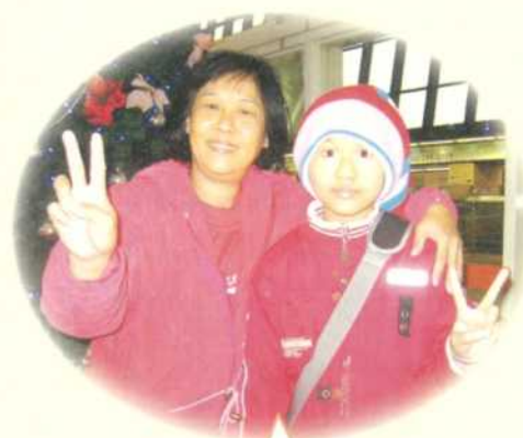
小美·11歲·惡性骨肉瘤·1月5-9日圓夢·我想去印尼看外婆