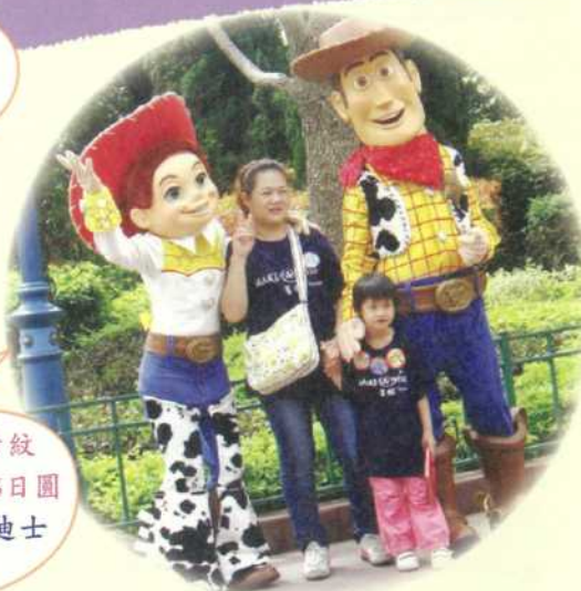
小葦·5歲·橫紋肌肉瘤·2月23-25日圓夢·我想去香港迪士尼樂園