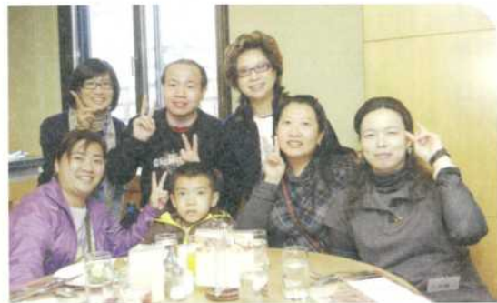
▲特別北上參加的南部志工