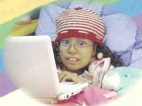
小瑀·10歲·神經母細胞瘤·1月14日圓夢·我想擁有筆記型電腦