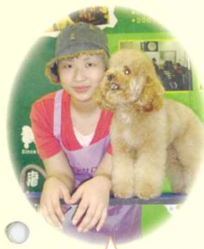
小庭·13歲·惡性腦瘤·2月24日圓夢·我想成為寵物美容師