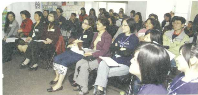
▲喜願開運鑑定團——星座及塔羅牌解析