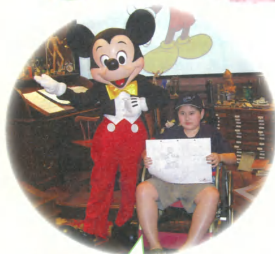
阿威·10歲· 想去迪士尼樂園找米奇·6月15~17日圓夢。米奇的家是一座城堡喔,我想要坐飛機去找米奇還要看看他的家,跟他握握手!