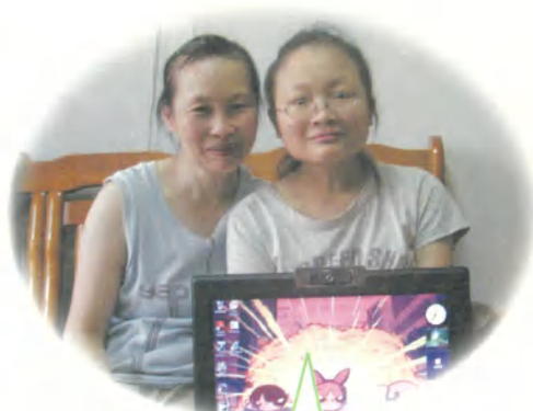
小惠·17歲·重度海洋性貧血· 我想擁有一台筆記型電腦·6月20日圓夢。我想帶著自己的電腦去學校跟同學討論課業,幫助我學習,感覺很棒呢!