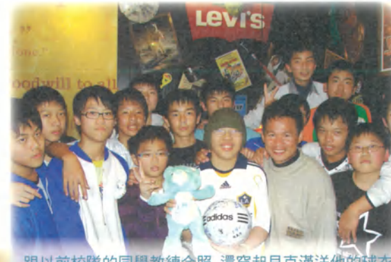
跟以前校隊的同學教練合照 還穿起貝克漢送他的球衣