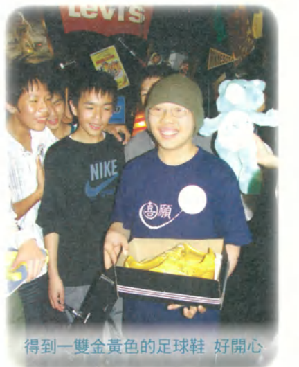
得到一雙金黃色的足球鞋 好開心