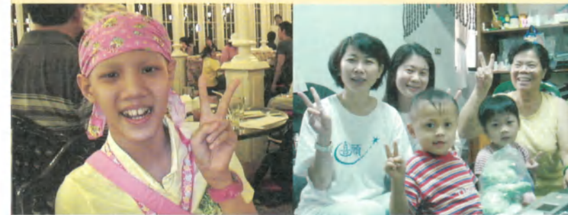
小萱·12歲·髓母細胞瘤(復發)·我想到去日本迪士尼·9月7-10日圓夢