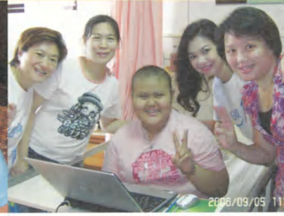
小鞠·14歲·惡性骨肉瘤·我要筆記型電腦·9月5日圓夢