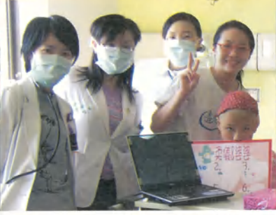
小儀·12歲·惡性淋巴瘤·我想到筆記型電腦·9月28日圓夢