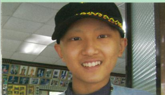
阿哲·17歲·下肢長骨惡性腫瘤 我想要演戲·2006年2月20-21日圓夢