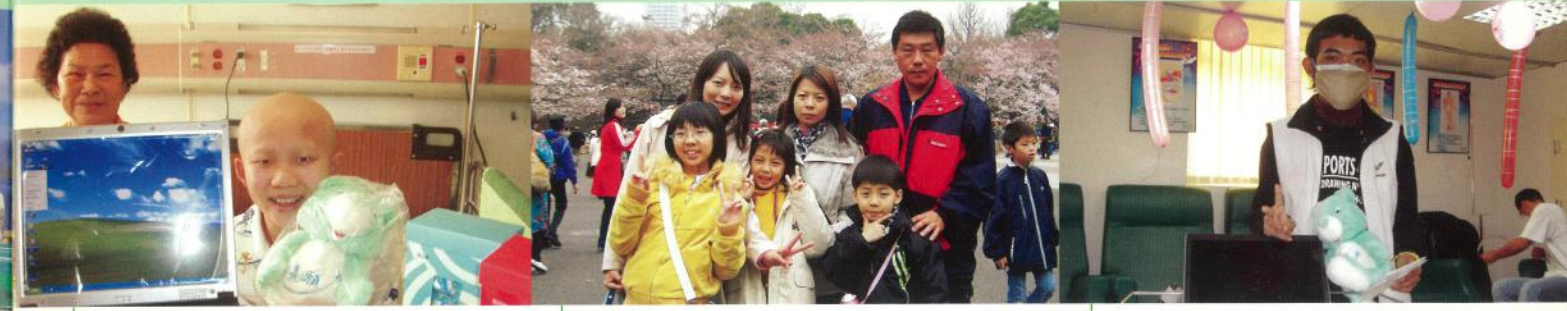
阿豪·11歲·骨肉瘤 我想要筆記型電腦·2006年2月17日圓夢