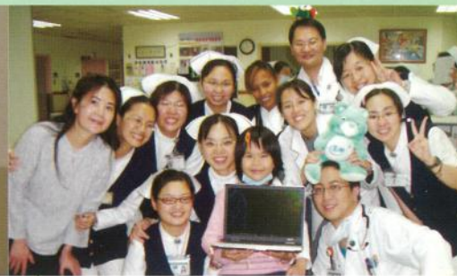
小芸·12歲·淋巴瘤併全身轉移 我想要筆記型電腦·2006年3月17日圓夢