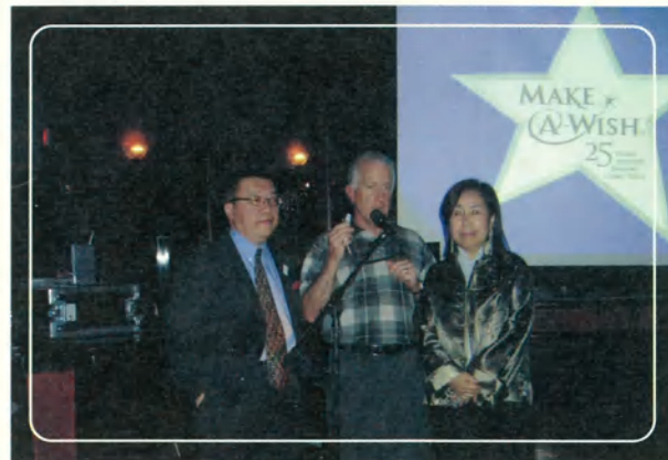
▲ 溫哥華國際年會中與台北圓夢現場連線分享喜願兒的快樂