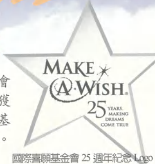
國際喜願基金會 25 週年紀念 Logo

1980 年國際喜願基金會成立於美國亞利桑那州鳳凰城，二十五年來，喜願基金會於全球共擴展了 31 個分會國，全球共實現超過 14 萬個病童的夢想。並在今年 4 月獲得美國最大的法人組織 Charity Navigator 的肯定，經過嚴謹的評選過程，國際喜願基金會組織在募款經驗、企劃、財務的運用及成長等各方面的表現獲得 4 顆星的榮譽。