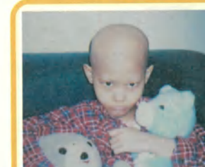
小仔 9 歲 / 惡性橫紋肌肉瘤 / 想要筆記型電腦 / 6 月 13 日圓夢