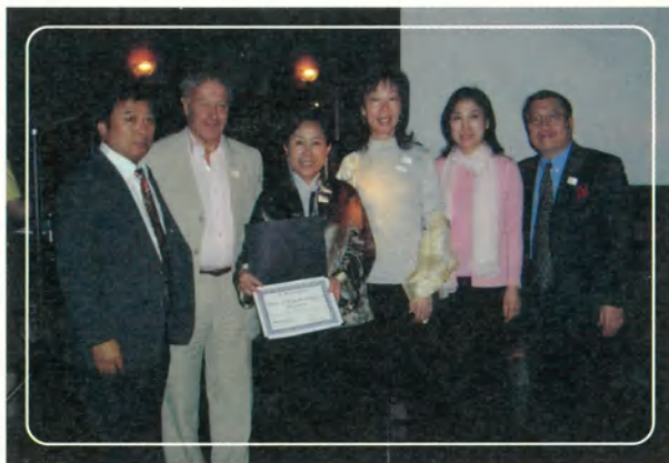
▲ 溫哥華國際年會時接受國際總會理事長 Peter White 表揚

走過喜願十年，從 2005 年開始，喜願期待將有更多的發展與轉變。我們正努力朝向在南部設立辦公室據點的目標前進，也希望能夠招募更多的喜願義工加入我們的行列，和我們一起關懷重症病童，讓他們的夢想能有機會展翅飛翔。但我們同時也面臨最大的考驗，便是現在募款的困境。雖然義賣「直到生命的電池耗盡」套書活動獲得了許多回響，我們仍需要積極的拓展圓夢基金，希望能為更多需要協助的重症病童實現夢想，也希望更多朋友和我們一起分享圓夢的神奇力量「Share the power of a wish」！