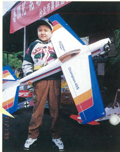
昆諺自己動手造飛機並讓他的 Willy 號飛上青天。