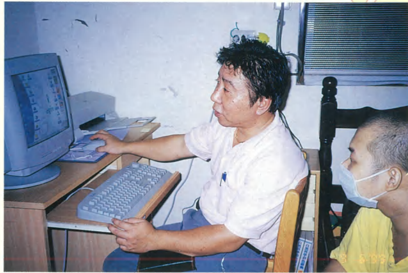
俊和的電腦讓他在學習上更能不落人後。