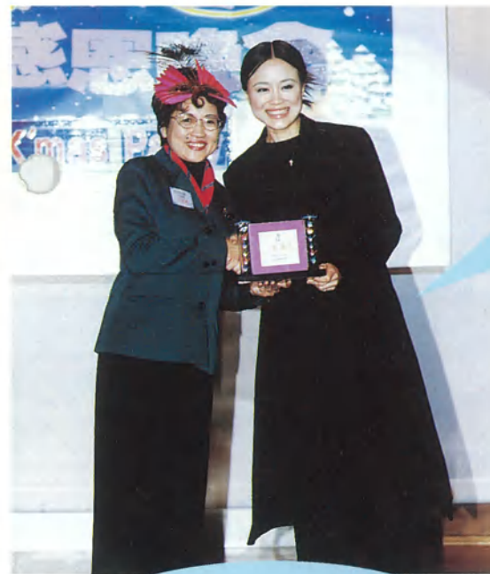
本會第二屆理監事三年來認真的投入喜願工作，為大家的努力鼓掌。