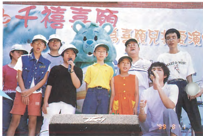
慶豐人壽 「點亮喜願的心」 義賣活動