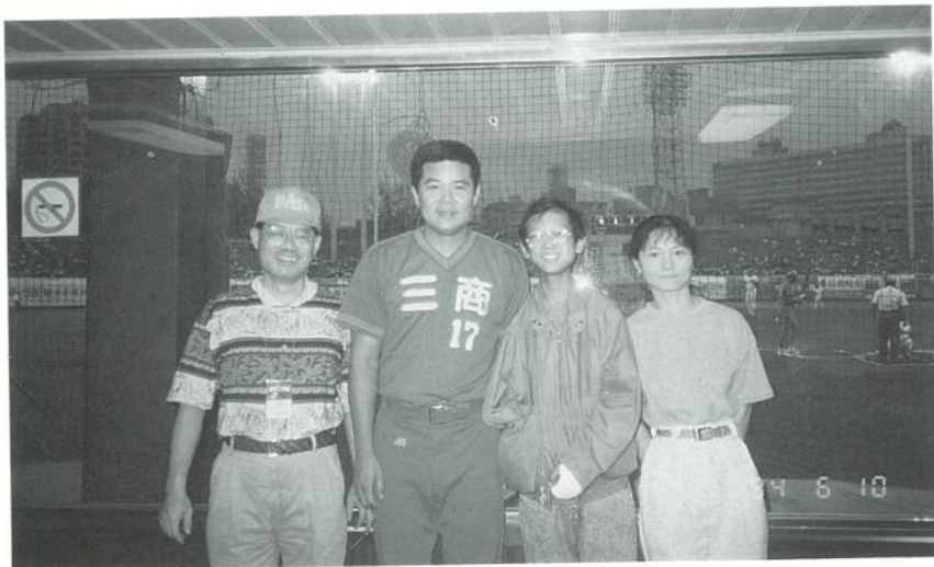
喜願兒阿强和三商虎隊明星球員、榮總社工人員、喜願協會會員合影