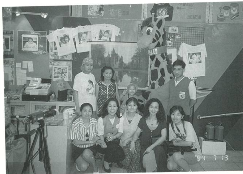
兩位喜願兒和她們的家人及榮總社工人員、喜願協會會員、反斗城工作人員合照於玩具反斗城。