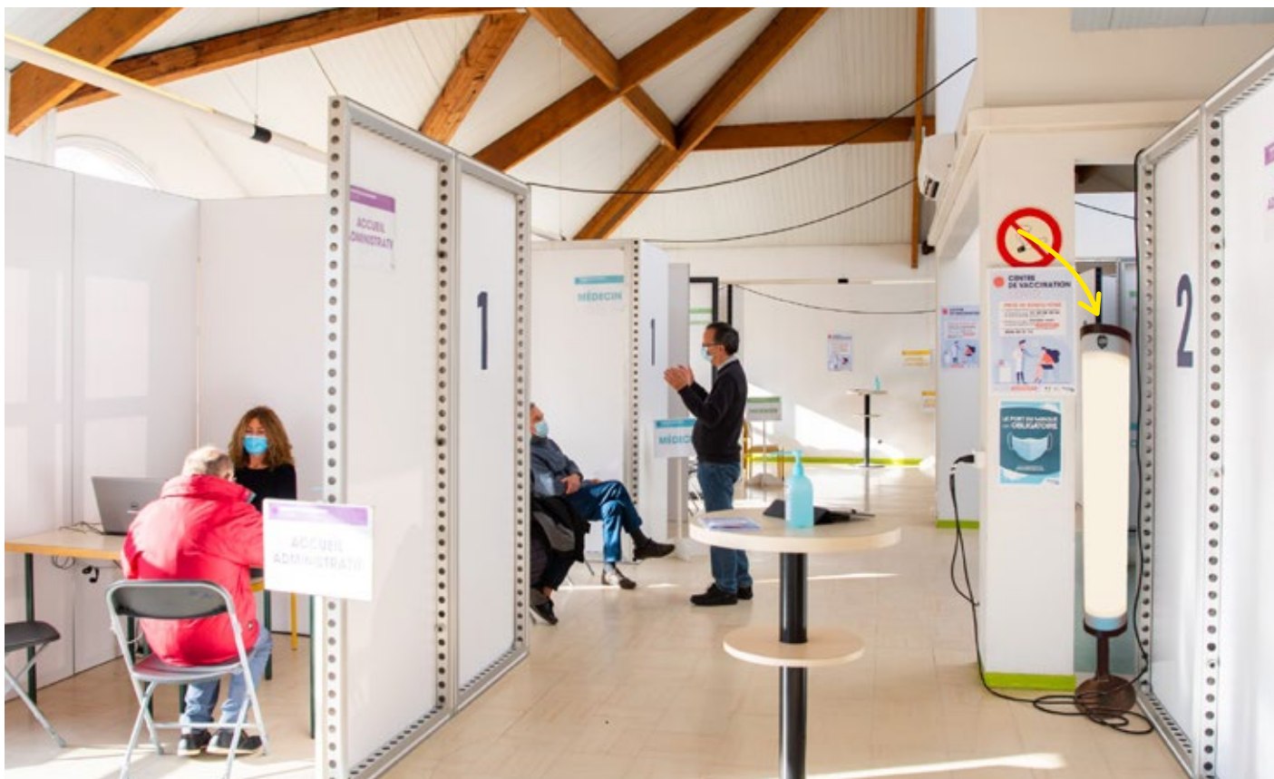
Au plus près de la lutte Anti-COVID