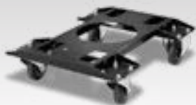
Vogn til WS trådfremfører 040977