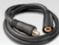
Polaritetsvendende kabel 033689