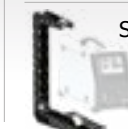
Slyngende støtte 036277