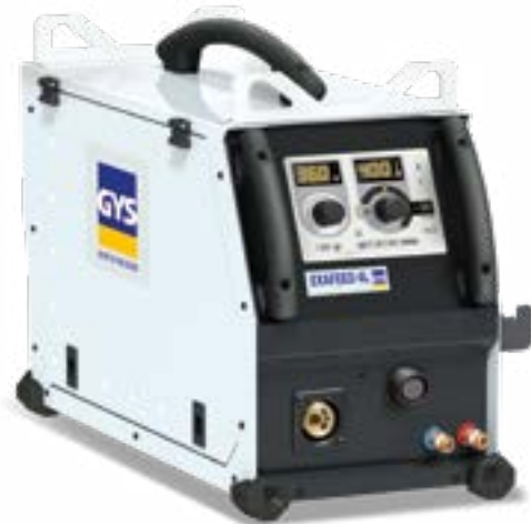
Leveres uden tilbehør