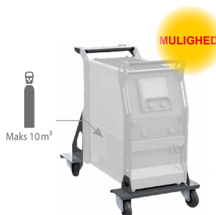
Vogn ref. 040960

Nem tilstand eller PRO-tilstand med adgang til alle parametre.