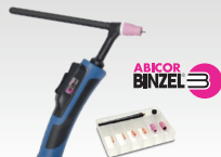
SR26DB - 4 m 038271