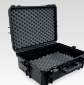
On-site etui IP67 060432