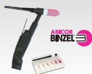
SR26L - 8 m 046184