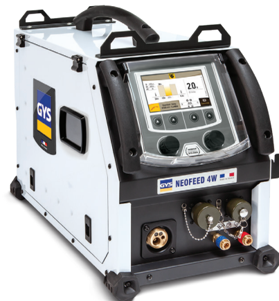
Leveres uden tilbehør