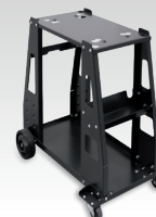
PLASMA 600 vogn 040298