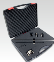
Kompass sæt 040205