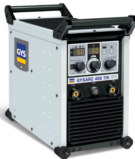
Leveres uden tilbehør