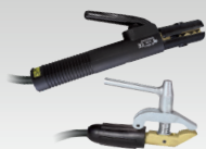
MMA-sæt 500 A - 4 m - 50 mm 2 047419