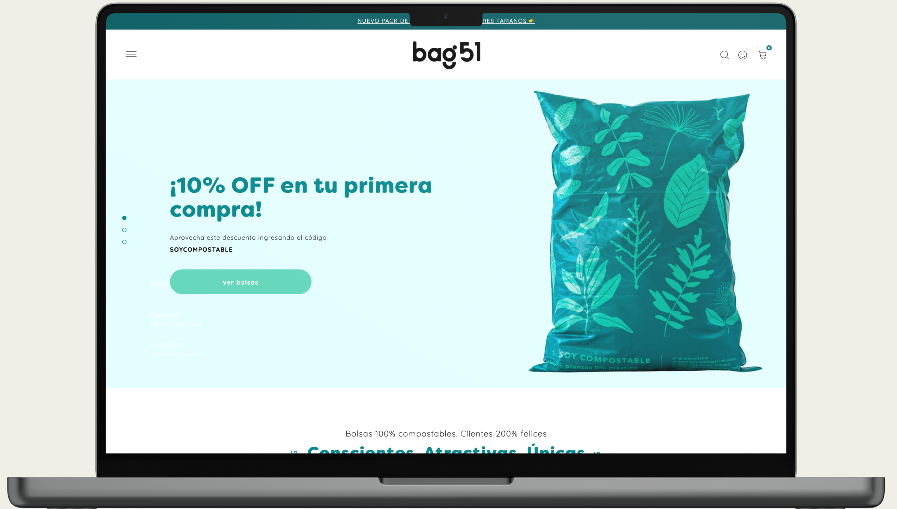
Ejemplo de aplicación