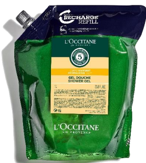
REVITALIZIRAJUĆI GEL ZA TUŠIRANJE 1000ml Ista formula kao kod dispensera