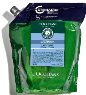
OPUŠTAJUĆI LOSION ZA TELO 1000ml Ista formula kao kod dispensera