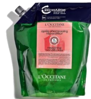
BALZAM ZA REGENERACIJU KOSE 1000ml Ista formula kao kod dispensera