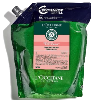
ŠAMPON ZA REGENERACIJU KOSE 1000ml Ista formula kao kod dispensera