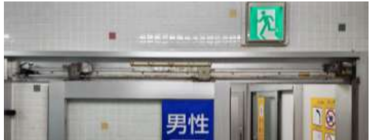
② 製品一式 (点検口カバーを開けた状態で。)