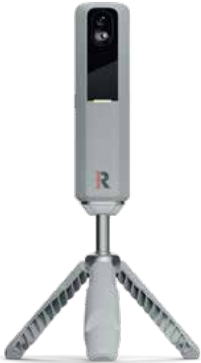
クイックスタートガイド