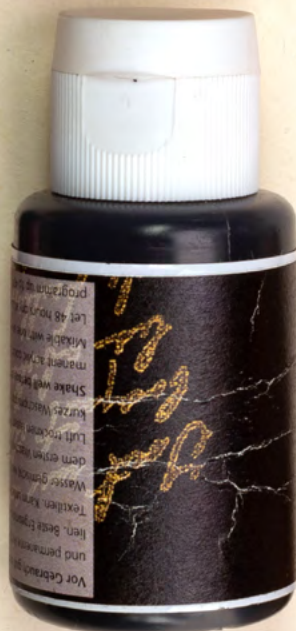
Stoffstempelfarbe für Stoff Eierdeko