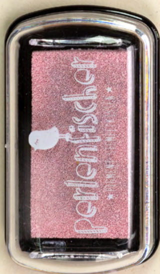
Pigmentstempelkissen für Papier Eierdeko