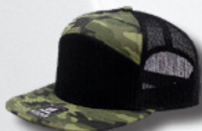
BLACK CAMO BLACK