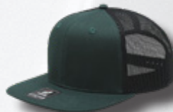
DK GREEN BLACK