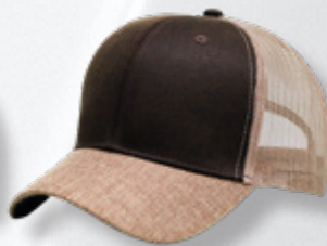
BROWN / KHAKI