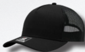
BLACK / BLACK