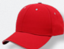
RED/GREY HASTA AGOTAR EXISTENCIAS