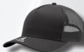
CHARCOAL / OXFORD