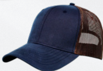
NAVY / BROWN