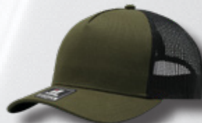
OLIVE / BLACK