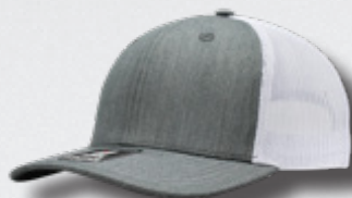
HEATHER GREY - WHITE