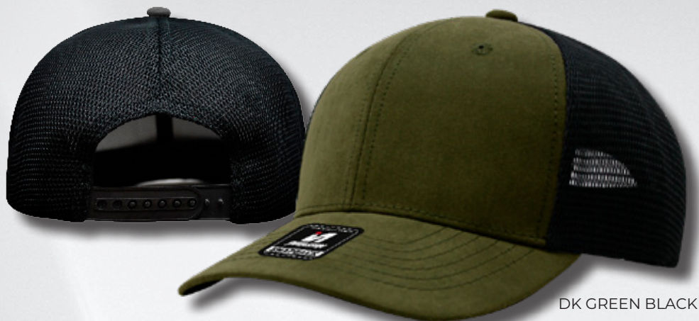
DK GREEN BLACK