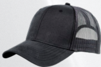
GREY / OXFORD