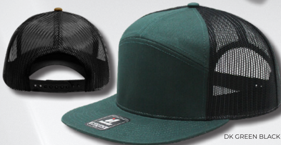
DK GREEN BLACK