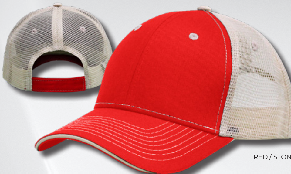
RED / STONE