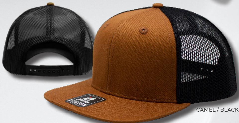
CAMEL / BLACK