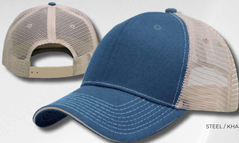
STEEL / KHAKI