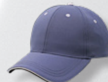
STEEL/WHITE HASTA AGOTAR EXISTENCIAS