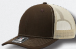
BROWN - STONE