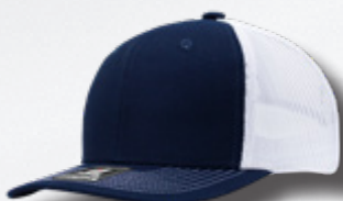
NAVY - WHITE