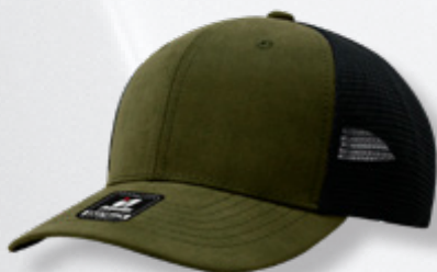
DK GREEN BLACK