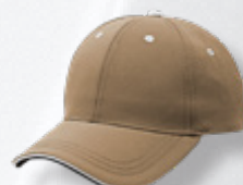
LT BROWN/WHITE HASTA AGOTAR EXISTENCIAS