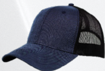
NAVY / BLACK