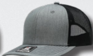
HEATHER GREY - BLACK