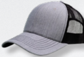
HEATHER GREY/ BLACK