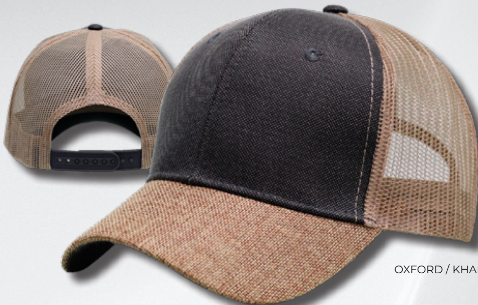
OXFORD / KHAKI