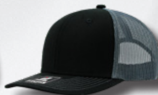
BLACK - OXFORD