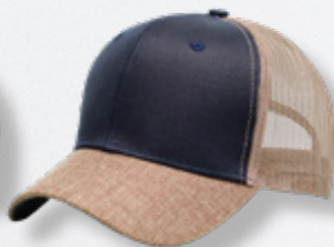
NAVY / KHAKI