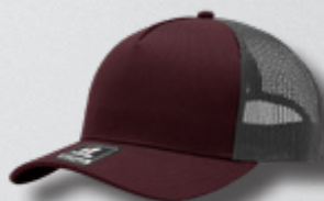
WINE / OXFORD