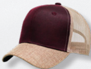
RED / KHAKI