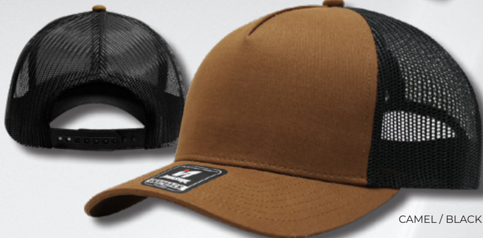
CAMEL / BLACK