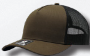
BROWN / BLACK