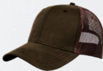
BROWN / LT BROWN