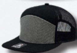
BLACK HEATHER GREY BLACK