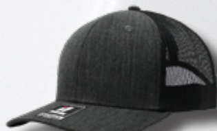
HEATHER BLACK - BLACK