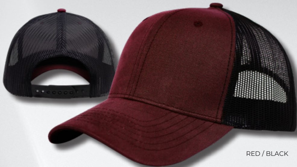
RED / BLACK