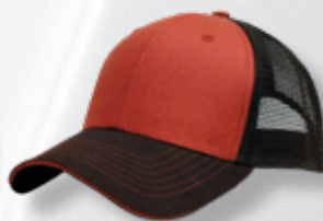
TX ORANGE / BROWN