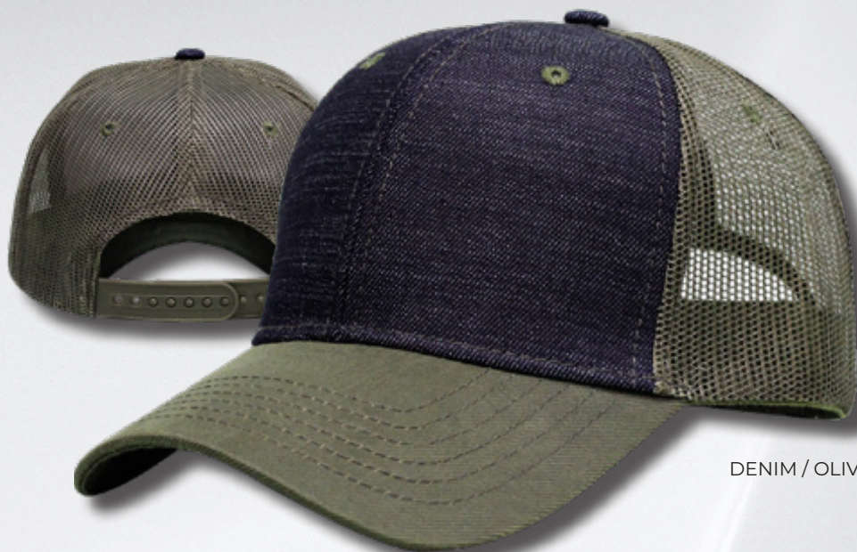
DENIM / OLIVE