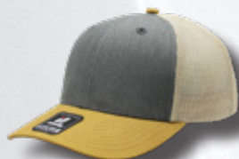
HEATHER GREY -MUSTARD-STONE