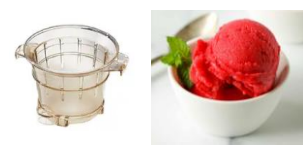
Einsatz für Glacés & Sorbets