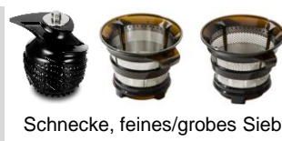
Schnecke, feines/grobes Sieb