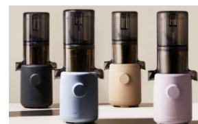
Farbpalette: Anthrazit, blau, beige, lavendel