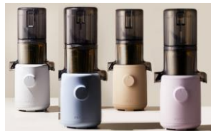
Farbpalette: weiss, blau, beige, lavendel