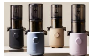
Gamme de couleurs: anthracite, bleu, beige, lavende