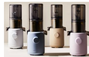
Gamme de couleurs: blanc, bleu, beige, lavende