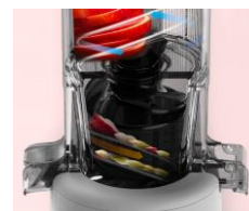
Extraction en douceur