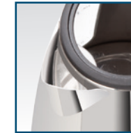
Herausnehmbarer, abwaschbarer Kalkfilter Filtre anticalcaire amovible et lavable Filtro anticalcare estraibile, sostituibile