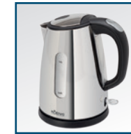
Hochwertiger 1 Liter Wasserkocher aus Edelstahl Bouilloire électrique de haute qualité en acier inoxydable d'une contenance de 1 litres Bollitore di ottima qualità in acciaio inox, capacità da 1 litro