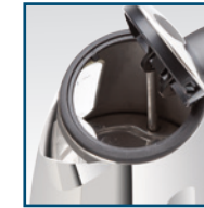
Verdecktes Heizelement Corps de chauffe recouvert Elemento riscaldante, coperto