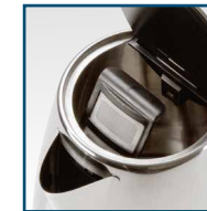
Herausnehmbarer, abwaschbarer Kalkfilter Filtre anticalcaire amovible et lavable Filtro anticalcare estraibile, sostituibile

Acquistando questo apparecchio, ha fatto una buona scelta. Con la giusta cura, risulterà assai utile negli anni. Prima della messa in funzione, leggere attentamente le presenti istruzioni per l'uso e soprattutto le indicazioni di sicurezza che seguono. Le persone che non hanno dimestichezza con le istruzioni per l'uso, non possono utilizzare l'apparecchio. Conservare la confezione per un utilizzo futuro. Eliminare comunque tutti i sacchetti di plastica, perché possono essere un gioco pericoloso per i bambini.