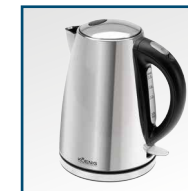
Hochwertiger 1.7 Liter Wasserkocher aus Edelstahl Bouilloire électrique de haute qualité en acier inoxydable d'une contenance de 1.7 litres Bollitore di ottima qualità in acciaio inox, capacità da 1.7 litro