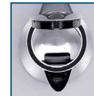
Verdecktes Heizelement Corps de chauffe recouvert Elemento riscaldante, coperto