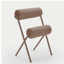
ロールチェア 18 脚