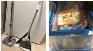
フロアワイパー 掃除用品BOX