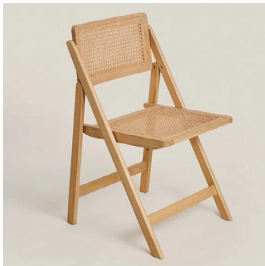
ウッドチェア 16 脚