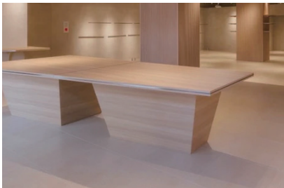
テーブル 1 脚 (360x170)