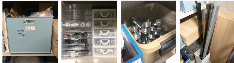
ワイヤー収納BOX フック収納BOX(右) 重石収納BOX バー、棚板収納エリア