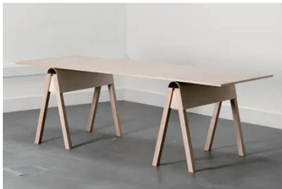
テーブル 6 脚 (180x90)