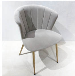
ソファ椅子 11 脚 (一部例)

プロジェクター、マイク (1 本)、音響システム (Bluetooth 対応)、Wi-Fi、ハンガーラック、フィッティングルーム、ピクチャーワイヤー、スタンド看板 (A4)、傘立て、姿見、キッチン設備、お荷物受取・発送 (同時予約がない場合のみご対応可能)